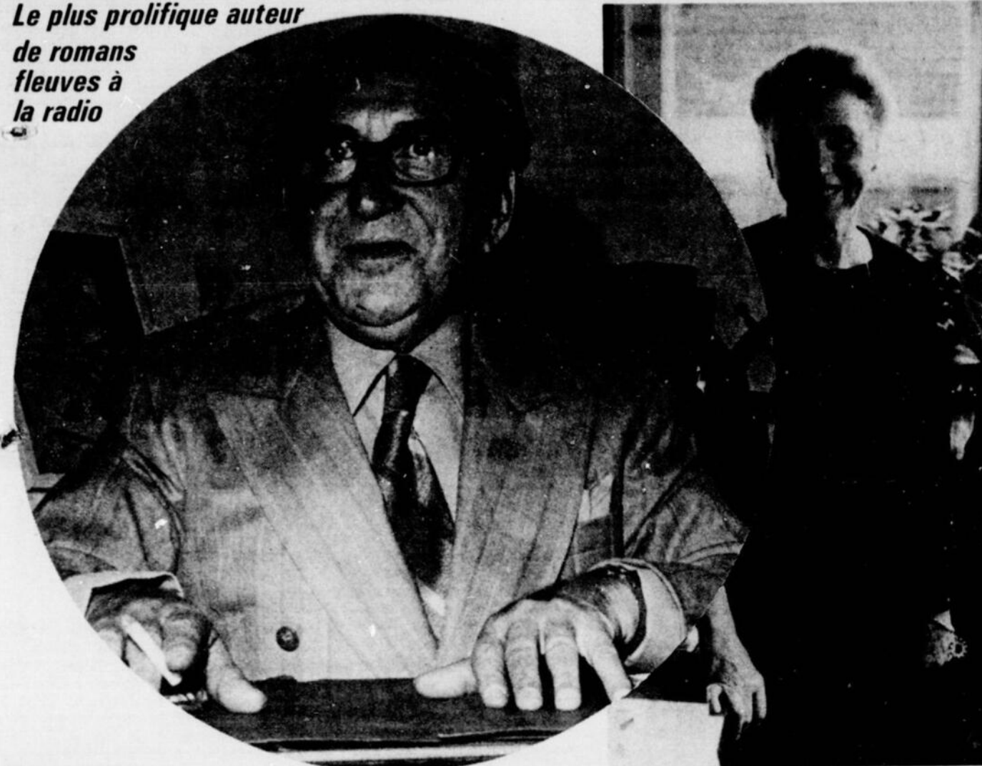
Même malade, Henri Deyglun continuait d'être un bourreau de travail.

Le plus prolifique auteur de romans fleuves à la radio