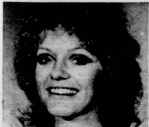
TRILLE ... $4,000 par semaine