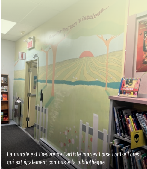
La murale est l'œuvre de l'artiste marievilloise Louise Forest, qui est également commis à la bibliothèque.

Vous aurez aussi accès à une foule de ressources inspirantes pour animer les périodes de lecture à la maison et faire découvrir l'univers fantastique de la lecture à votre enfant.