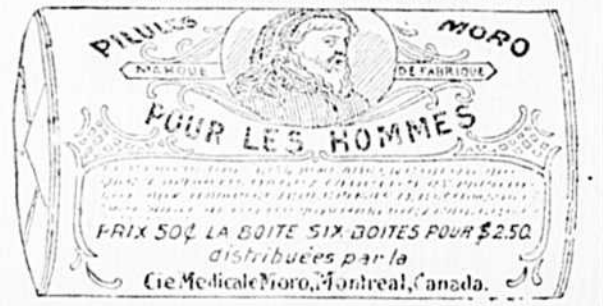
Fac-Similé d'une boîte de Pilules Moro.