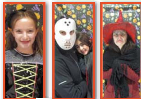
Halloween sur glace 2014