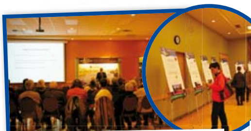
Dévoilement des 16 projets retenus et vote de la population - 8 octobre