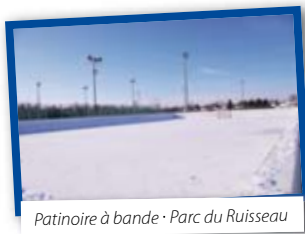
Patinoire à bande · Parc du Ruisseau