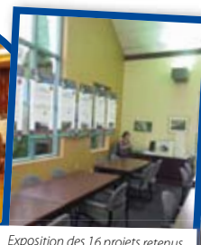
Exposition des 16 projets retenus et vote de la population 9 au 19 octobre