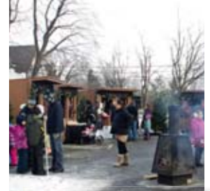
Marché champêtre de Noël 2013