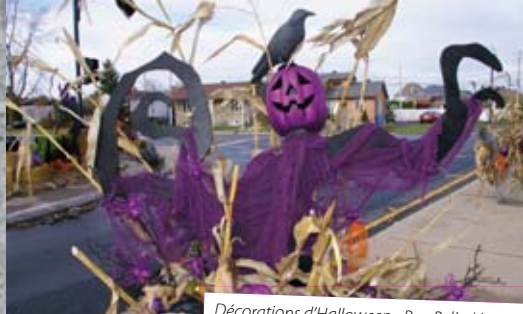
Décorations d'Halloween - Rue Bella-Vista