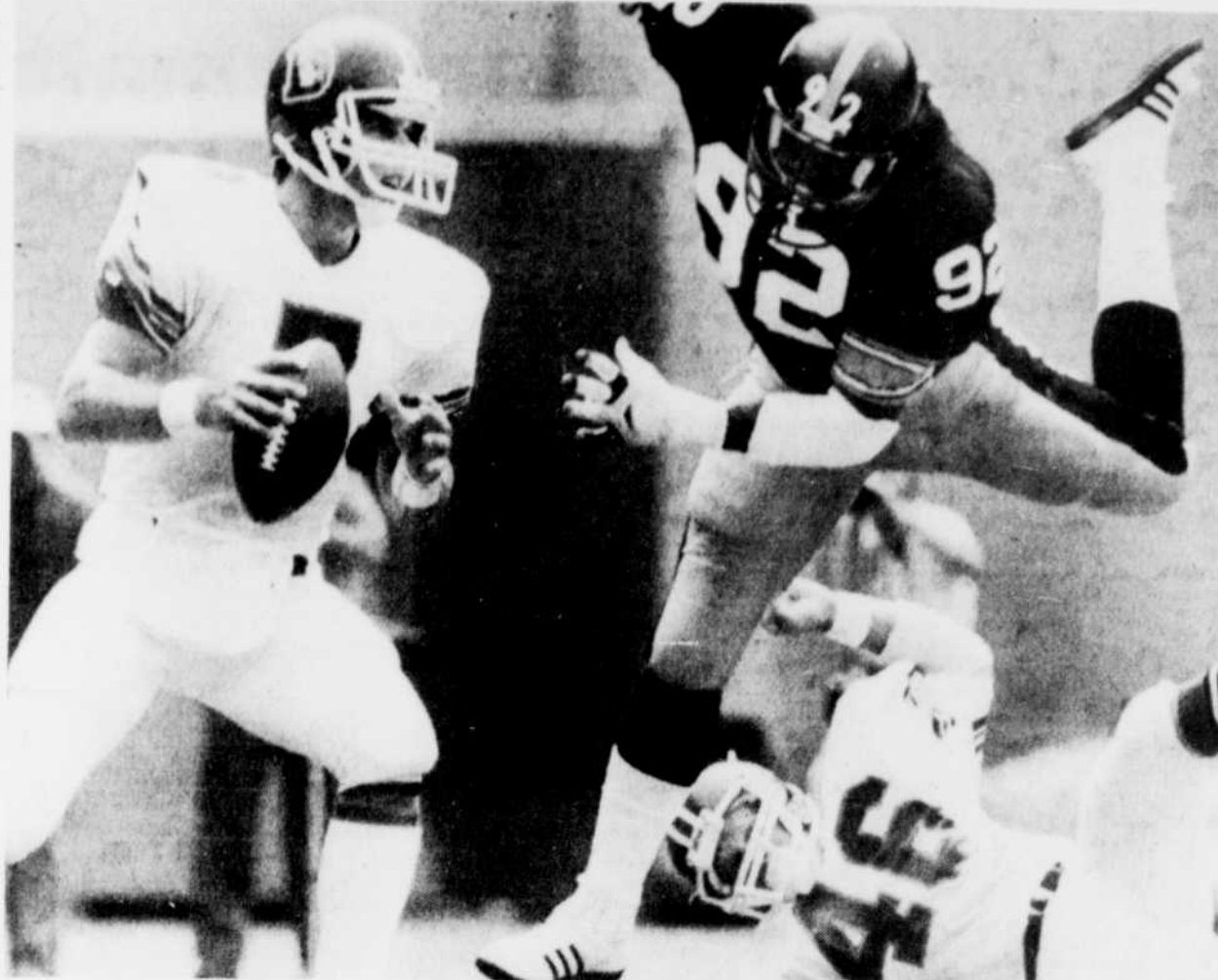
Les Steelers de Pittsburgh ont souhaité la bienvenue à leur façon au quart-arrière-recrue John Elway des Broncos de Denver (7). Elway a finalement été blessé et il a quitté le match après la première demie.

La défensive des Dolphins s'est fait impénétrable en plus d'inscrire deux interceptions-clés.