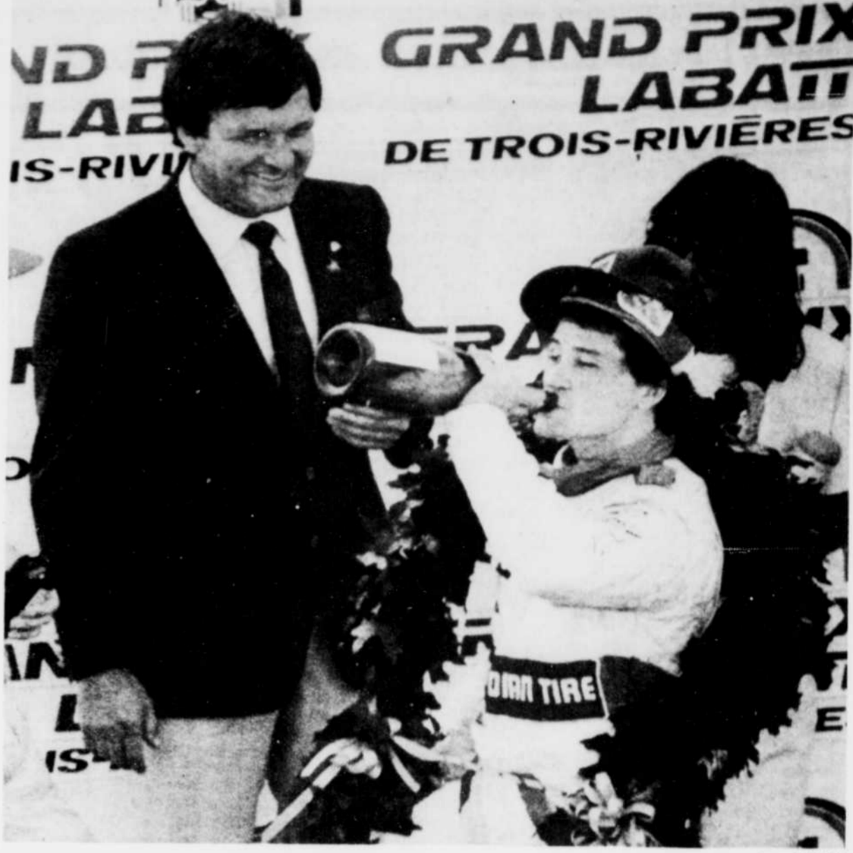
Jacques Villeneuve ne s'est pas fait prier pour sabler le champagne après sa brillante victoire.

TROIS-RIVIÈRES (PC) — Jacques Villeneuve de St-Cuthbert a mené de fil en fil pour remporter une victoire facile en course Can-Am, dimanche, lors du Grand Prix de Trois-Rivières.