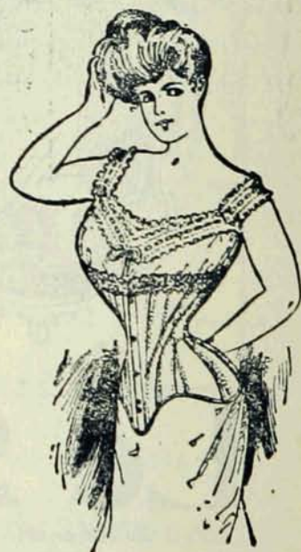
MODELES LES PLUS NOUVEAUX.

Les Dames qui insistent pour avoir les Crompton ne le regrettent jamais.