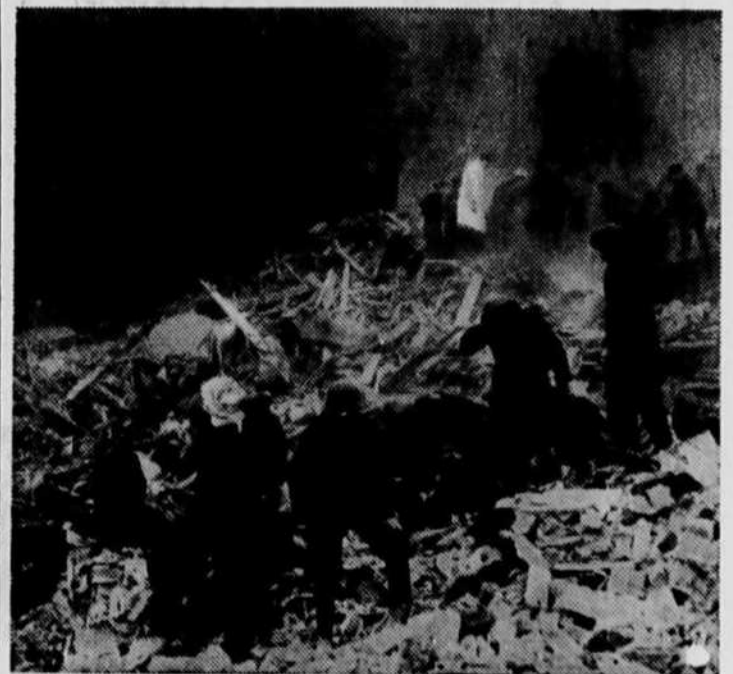
Les équipes de secours s'affairent, parmi les débris, après l'éclatement d'une bombe.