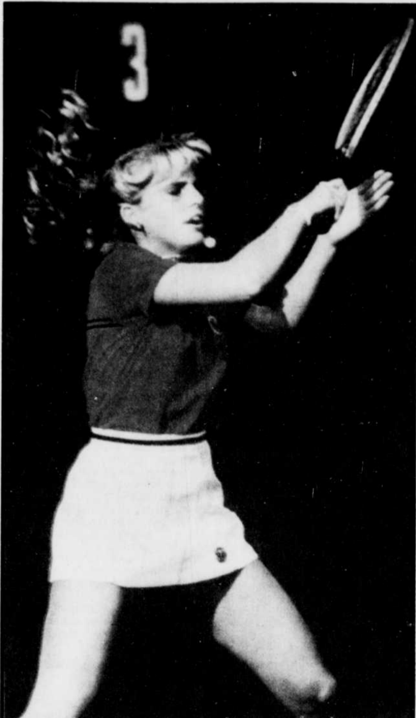
Carling Bassett a une grosse commande sur les bras: tenter de vaincre Chris Evert-Lloyd.

Arts et divertissements Informations générales