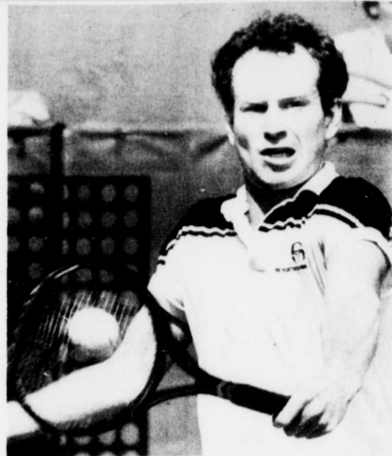
John McEnroe affrontera son compatriote Jimmy Arias en quart-de-finale aujourd'hui.

"Je ne crois pas que Al se retire, a dit Bossy. Je lui ai parlé après les séries et il semblait encouragé. Comme je le connais, je crois qu'il voudra relever le défi et tenter de remporter la coupe Stanley une autre fois. S'il quittait, je serais très déçu. J'ai beaucoup de respect pour Al Arbour, l'entraîneur".