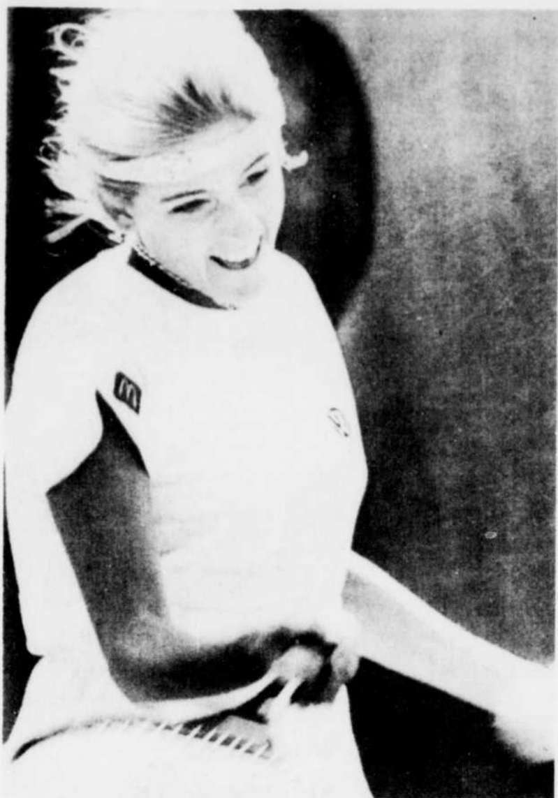
Carling Bassett se mesure aujourd'hui à Chris Evert-Lloyd.

PARIS (PC) — Quand le tennis professionnel n'est plus une partie de plaisir, il est temps de faire autre chose. C'est ce que croit Carling Bassett, qui, à 16 ans, a acquis beaucoup plus de maturité que la plupart des filles de son âge au cours des deux dernières années sur le circuit professionnel.