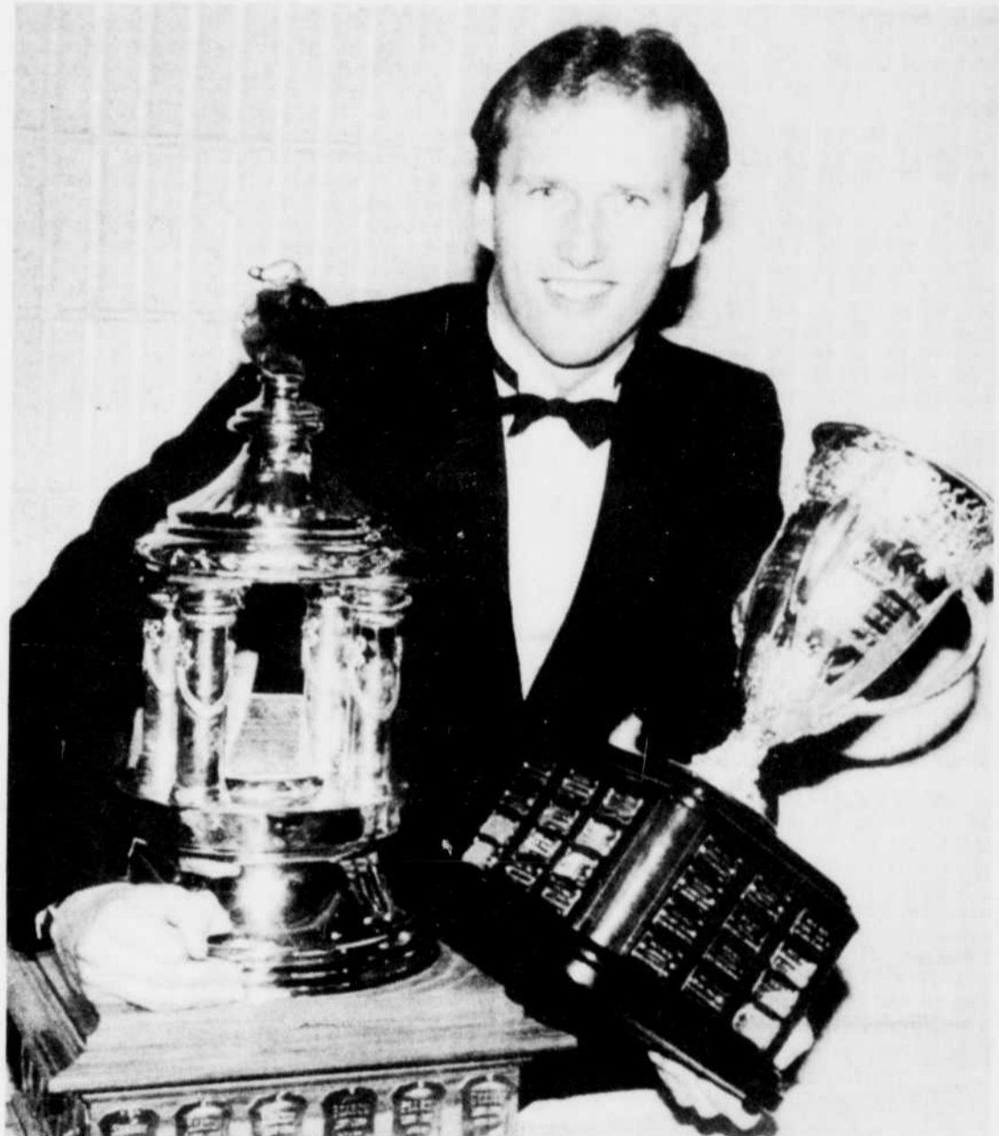
Un joli début de collection pour Tom Barrasso: le trophée Vézina et le trophée Calder.

Mike Bossy, des Islanders de New York, a mérité le trophée Lady Byng pour la deuxième année d'affilée, trophée remis au joueur le plus gentilhomme.