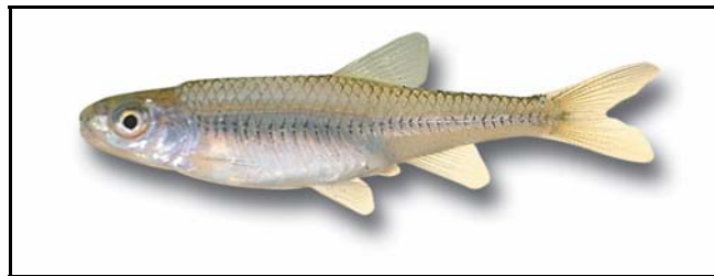
Figure 1. Méné d'herbe.

d'insertion des nageoires pelviennes peuvent permettre de distinguer le méné d'herbe adulte d'autres espèces semblables (Robitaille, 2005).