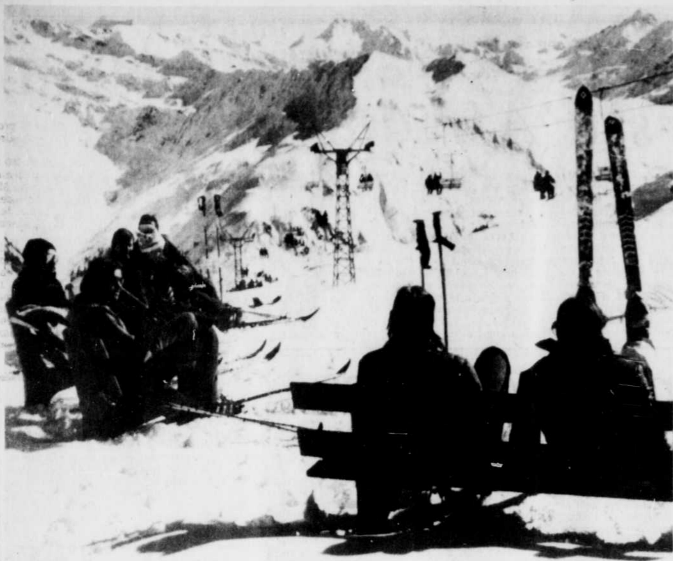
5,3 millions de Français et 800,000 étrangers pratiquent le ski dans les massifs montagneux de la France.