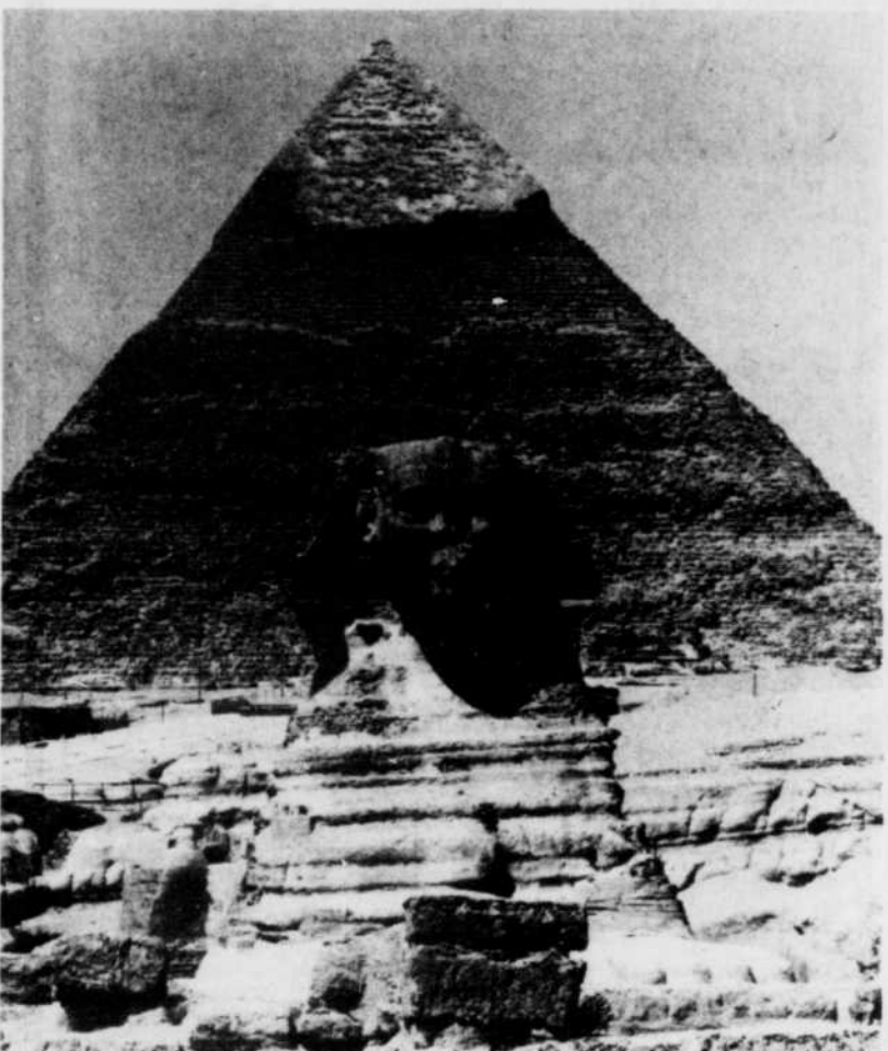
Tous les monuments de l'ancienne Egypte et même le Sphinx ont subi, à des degrés divers, les attaques du temps et des intempéries.

Mais l'étude entreprise comprend également un travail de restauration. L'égyptologue Ray Johnson tente d'identifier d'après le style du sculpteur, les fragments de fresques du temple de Louxor. En cinq ans, 1.300 fragments ont été identifiés. Il a reconstitué une fresque murale de 1,5 mètre de large sur 21 mètres de longueur. "C'est comparable à 100 puzzles mêlés ensemble avec 80 pour