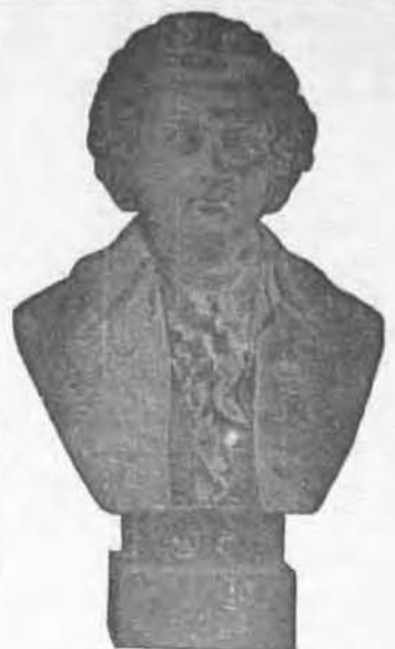
BUSTE DE MOZART

Cette fête a eu lieu en la résidence de cette dernière, 1276 Avenue DeLorimier. Les riches cadeaux suivants lui ont été offerts: Par le Chœur de Chant de la Congrégation et par le Chœur de la Messe de 9 heures, un buste en marbre de Carrare, sur piédestal, si hautement apprécié dans le monde artistique; par les Dames de Ste-Anne, en sa qualité d'ancienne organiste, un magnifique cru-