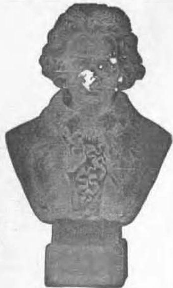
BUSTE DE BEETHOVEN

Envoyé gratuitement à toute personne qui nous fera tenir le prix de deux abonnements d'un an, soit $3.00. Sans préjudice à la prime régulière.