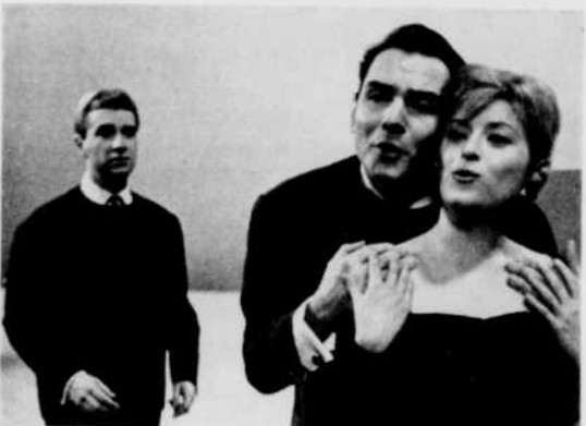
Les Trois Ménestrels