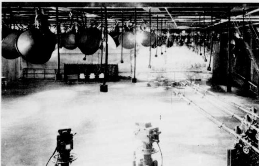
Le studio 42 de Radio-Canada à Montréal.

stade, à l'atelier ou au studio où ils travaillent afin de bien les « situer ».