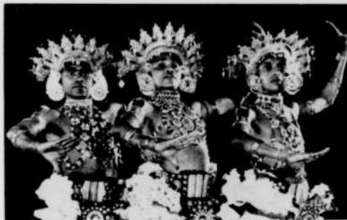
Figures de danses cingalaises