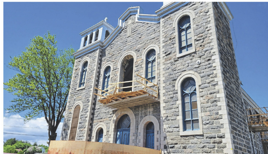
L'église de Sainte-Geneviève-de-Batiscan est en rénovation depuis environ un an pour faire place au projet d'habitation.

Celle qui porte aussi les chapeaux de présidente du Conseil du Trésor et de ministre responsable de l'administration gouvernementale convient que c'est toute une gymnastique administrative qui a conduit à l'annonce d'aujourd'hui.