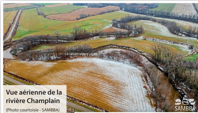
Vue aérienne de la rivière Champlain