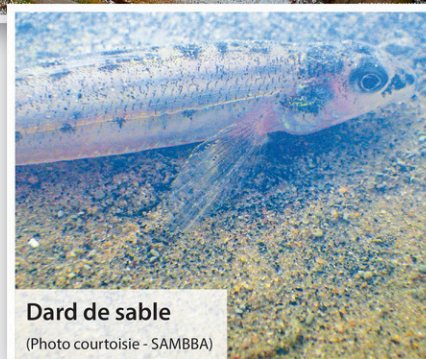
Dard de sable