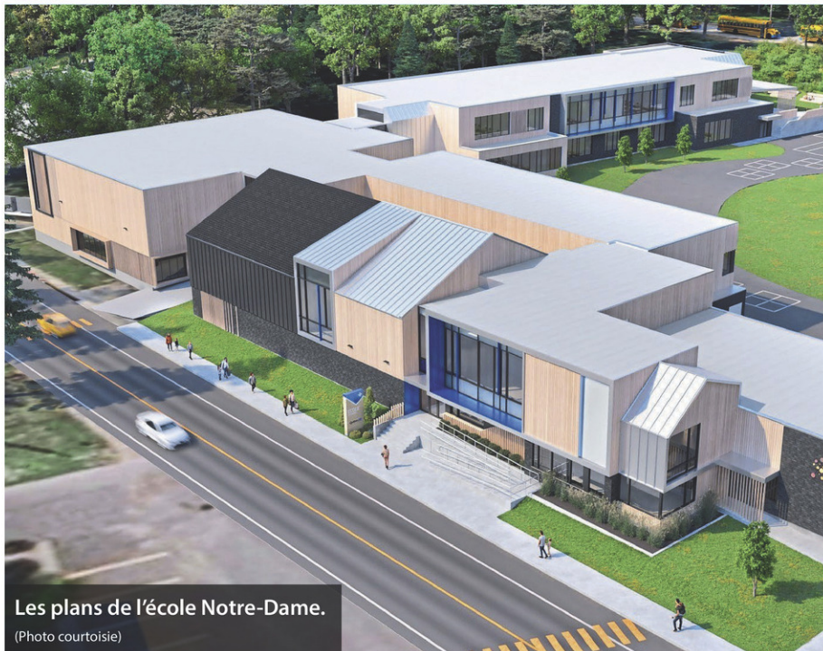
Les plans de l'école Notre-Dame.