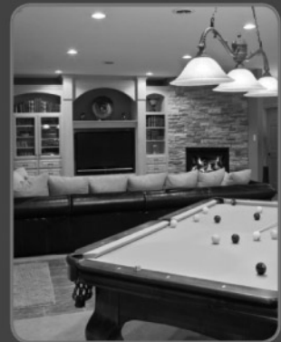
CANADA BILLARD A BOWLING SUPPLY SINCE 1972