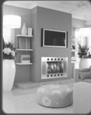
TRAVIS INDUSTRIES HOUSE OF FIRE