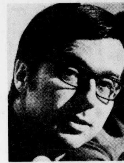
Le premier ministre Robert Bourassa