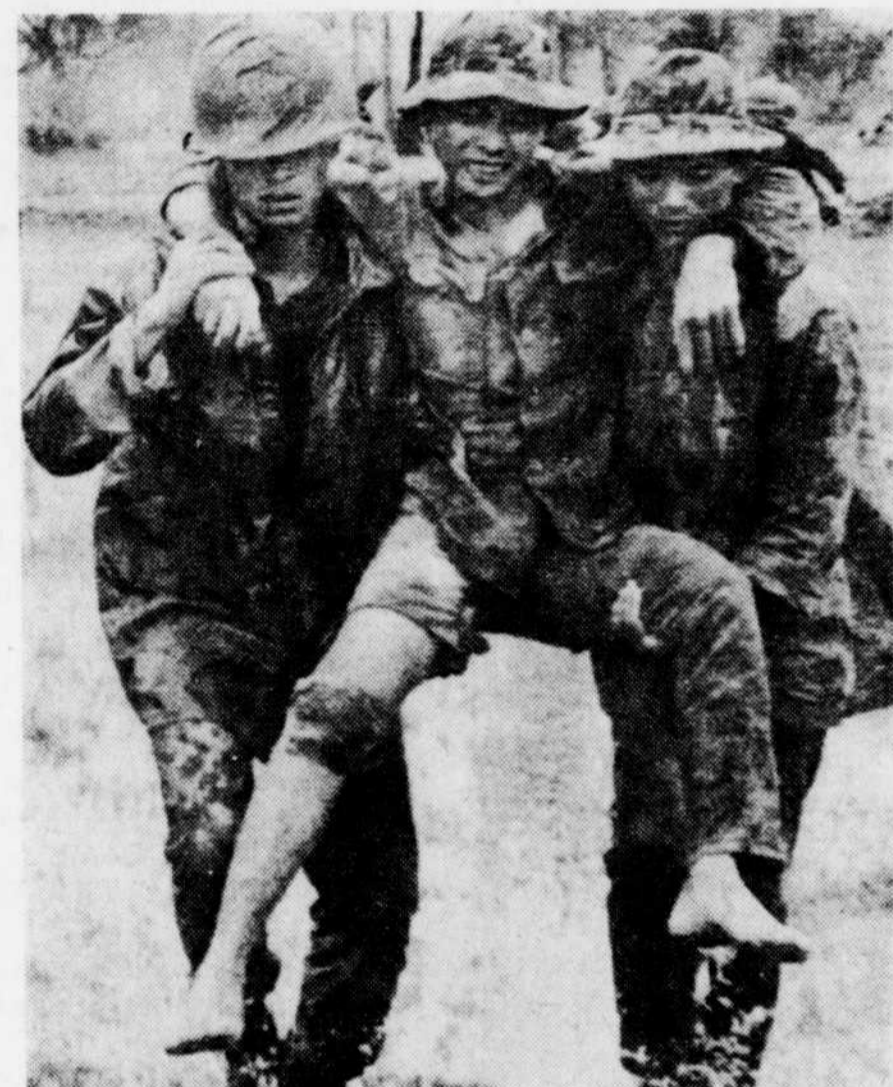
La guerre se poursuit toujours au Vietnam. Malgré les négociations de paix, des hommes sont blessés ou tués tous les jours. Deux soldats sudvietnamiens transportent un de leurs compagnons d'armes qui a été blessé quelques heures plus tôt. Pour le blessé, la guerre est finie... du moins temporairement!