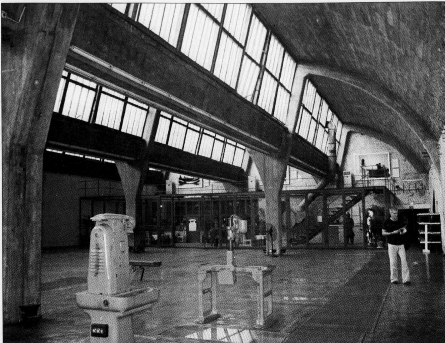
De style Bauhaus et dotée d'un fenêtrage généreux, l'ex-unité de production 798 est particulièrement impressionnante. Dans certaines de ses salles d'exposition, de vieilles pièces d'équipement de l'usine ont pratiquement l'air d'installations...