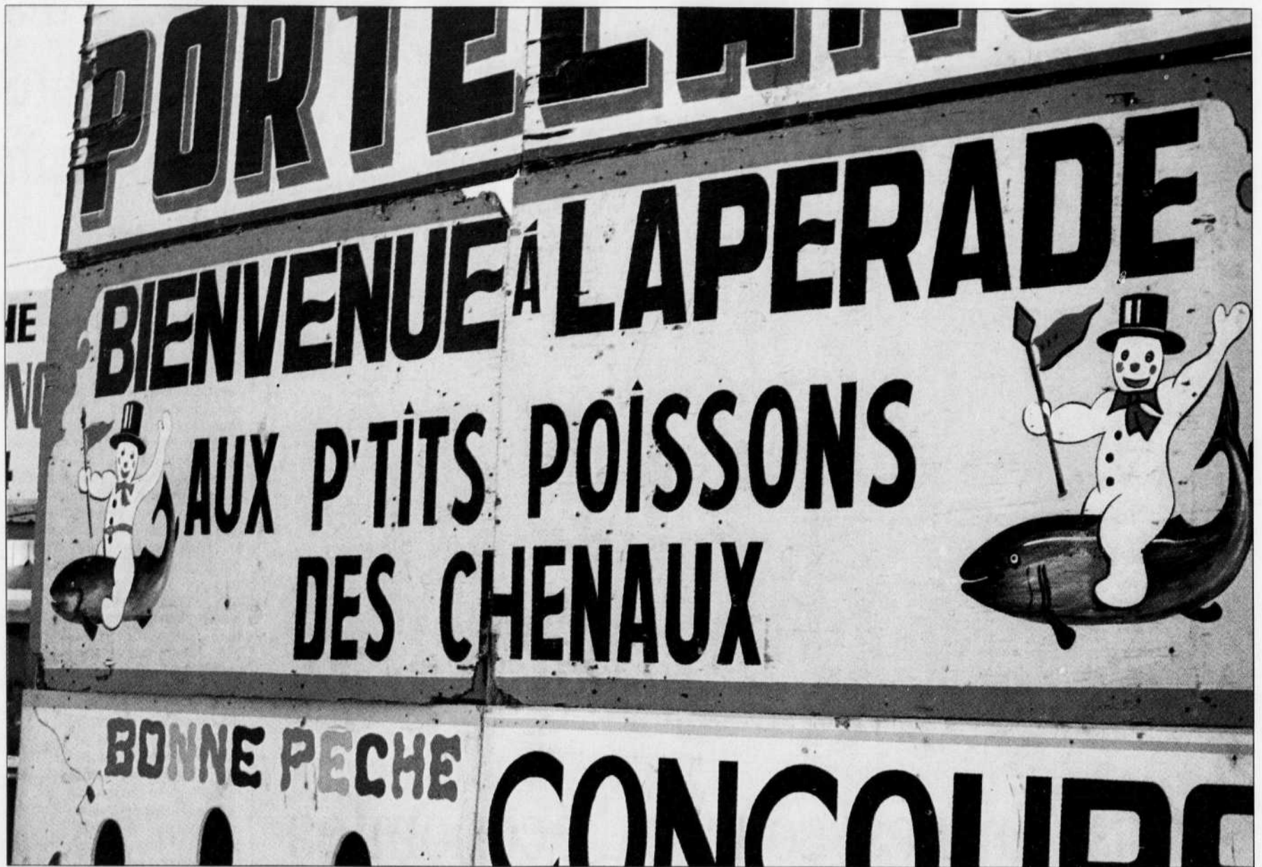
Le poulamon changé en saumon? Quel changement ce serait! On viendrait de partout voir et contempler le phénomène de Sainte-Anne-de-la-Pérade, et la rivière deviendrait sans nul doute un haut lieu protégé et recherché au Québec.

Et si c'était vrai! Le Québec est devenu un lieu dédié à la gastronomie et le gouvernement vient de créer pour la première fois les AOQ (appellations d'origine québécoise). Toutes les provinces canadiennes s'inspirent du bien-manger québécois, devenu la référence gastronomique indéniable en Amérique du Nord. Michelin, avec son fameux guide rouge, initie pour la première fois un classement étoilé des restaurants et auberges de renom. Pour la première année, coup de théâtre: trois nouveaux macarons au Michelin, dont deux à Québec et un étoilé à Chicoutimi. Stupéfaction dans le milieu montréalais qui s'attendait à ramasser la palme. Rien à perdre