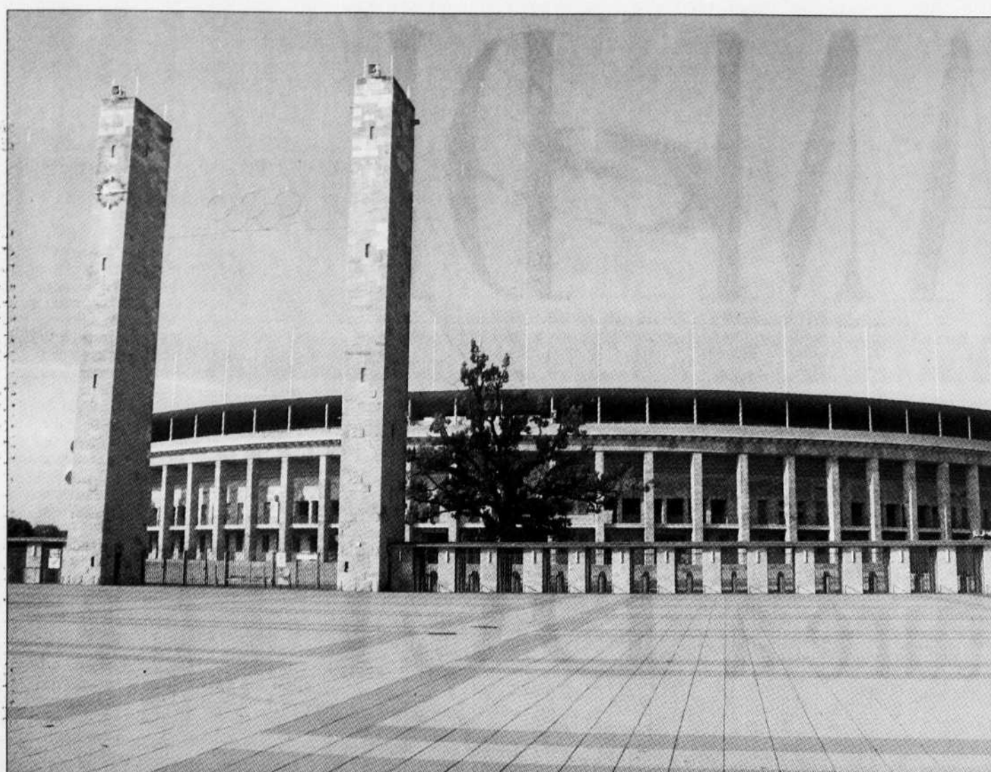
Même de loin, le stade olympique de Berlin impressionne par ses formes classiques et gigantesques.

APRÈS LA VISITE CULTURELLE DE BERLIN, POURSUIVONS LA PROMENADE VERS LE STADE OLYMPIQUE, UN DES RARES MONUMENTS DU NAZISME TOUJOURS DEBOUT. D'AILLEURS, LE DESIGN DE TOUS LES ÉLÉMENTS — DU STADE ET DE LA PISCINE OLYMPIQUES NOTAMMENT — EST À L'IMAGE DE L'ARCHITECTURE MONUMENTALE NAZIE. AUSSI, NOUS VOUS OFFRONS UN COUP D'ŒIL SUR HAMBURG, LA DEUXIÈME PLUS GRANDE VILLE D'ALLEMAGNE.