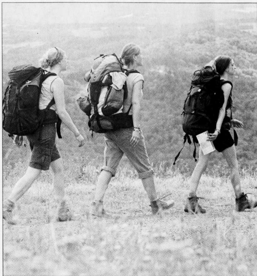
Trois voyageuses bien équipées en pleine promenade dans la très imaginaire région de Gotham. Elles ont visiblement préféré la marche à pied à la randonnée à dos d'âne...

C'est à Diranda que vous trouverez la grande île de l'archipel Mardi divisée en deux royaumes. En débarquant à Diranda, le touriste sera surpris par le grand nombre d'aveugles, de culs-de-jatte, de manchots et d'estropiés divers, tous victimes de la coutume locale qui veut que soient très fréquemment organisés des combats de gladiateurs où s'affronte la jeunesse des