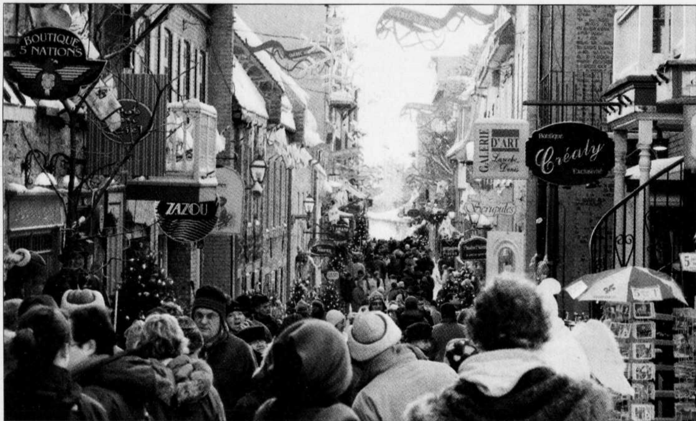
Dans nos rêves les plus fous pour 2008, le célèbre guide Michelin récompenserait des restaurants de la Vieille Capitale.

pendant, car Montréal se distingue avec pas moins de 17 restaurants ayant obtenu deux macarons et cinq restaurants, un macaron. Tourisme Montréal et son patron Charles Lapointe jubilent. Même si l'on eut souhaité voir Toqué!, XO, Picard et quelques