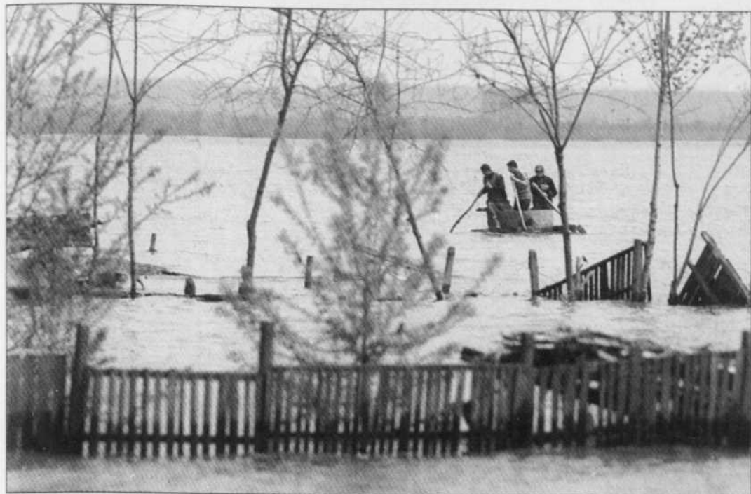
Des habitants de Fetesti, à 150 km de Bucarest, en Roumanie, tentent de rejoindre la terre ferme après avoir dû évacuer leurs maisons inondées hier par le débordement du Danube.