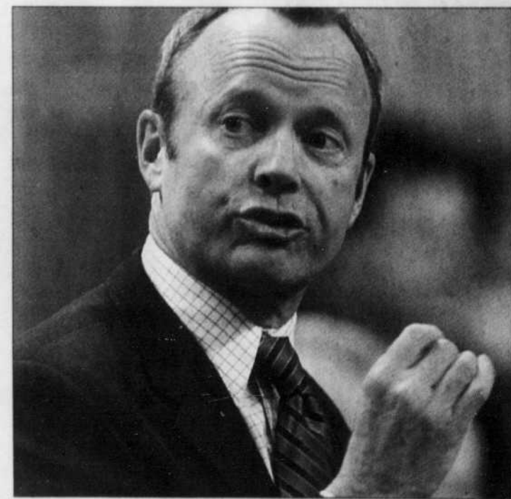
Le ministre fédéral de la Sécurité publique, Stockwell Day