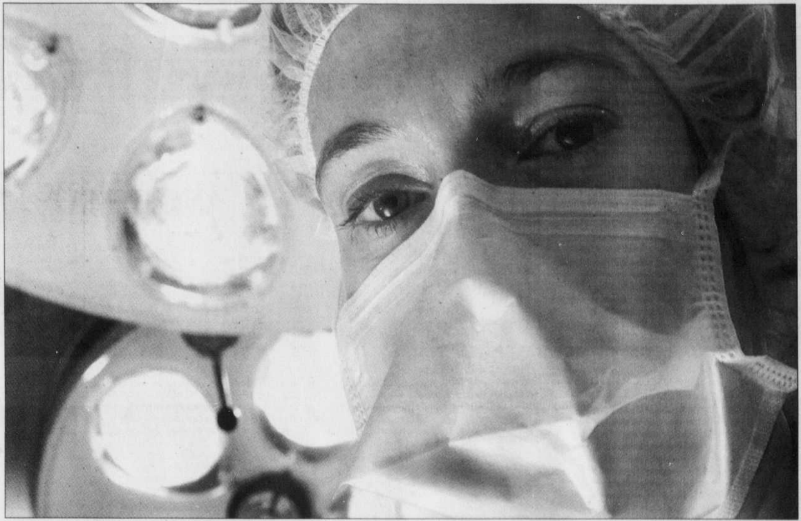
JACQUES NADEAU LE DEVOIR

Certains disent que changer le mode de fonctionnement de la médecine et ainsi attaquer de front le gouffre sans fond du système de santé et finalement le problème de la dette ne serait pas accepté par la population. Pourtant, la récente étude prospective du Conseil de la science et de la technologie, avec une large enquête auprès de la population et des chercheurs, montre que les deux plus importants défis des dix prochaines années que devra affronter le Québec sont, d'abord, l'adoption de saines habitudes de vie pour favoriser la santé et, ensuite, la recherche d'une autre efficacité du système de santé. Mais, pour cela, il faudrait du courage et de la persévérance de la part de nos gouvernements!