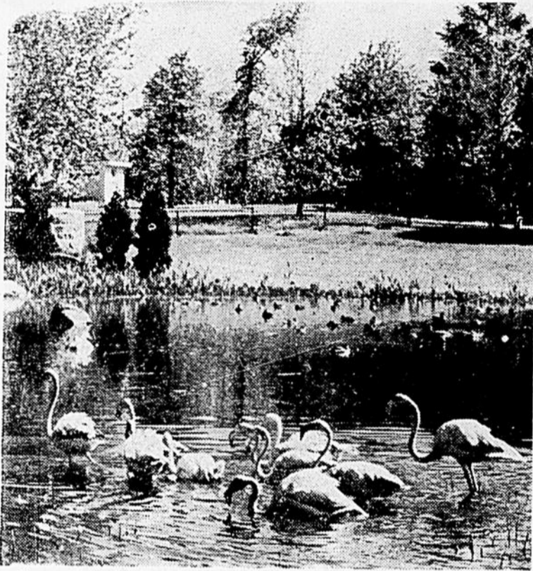
Un groupe de Flamants Roses au Jardin Zoologique de Québec.

Parce que le flamant a toujours suscité l'admiration des visiteurs, le Zoo de Québec, a fait, cette année, l'acquisition de plusieurs espèces nouvelles, et a même aménagé un grand étang au pied du totem où le public peut les voir dans un habitat naturel. L'étang des flamants du Jardin Zoologique de Québec est très coloré puisque l'on y trouve des flamants des deux espèces rose et blanche.