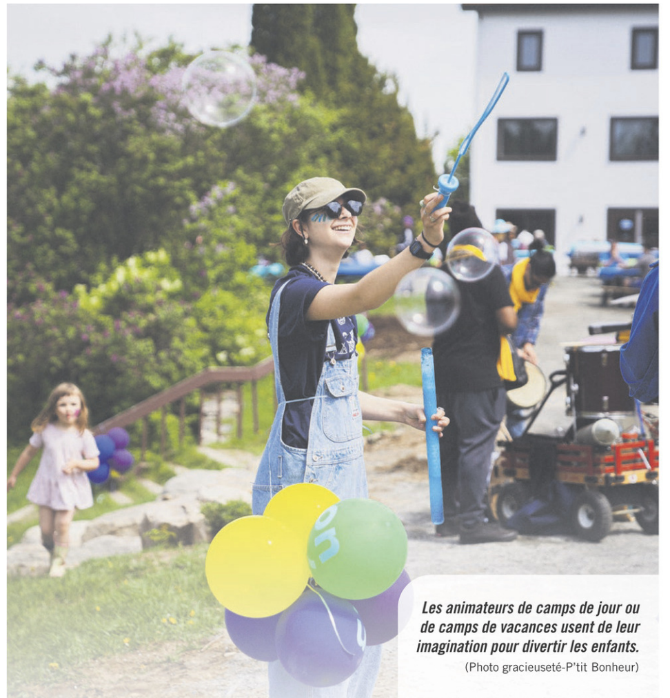
Les animateurs de camps de jour ou de camps de vacances usent de leur imagination pour divertir les enfants.

Centre intégré de santé et de services sociaux des Laurentides Québec