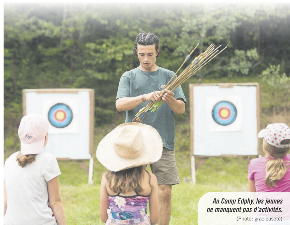
Au Camp Edphy, les jeunes ne manquent pas d'activités.