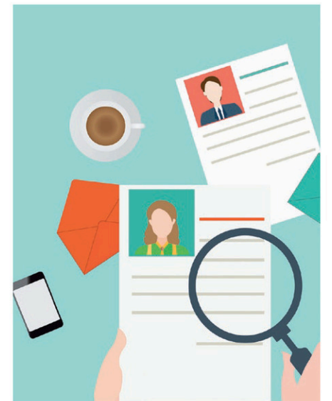
table et votre numéro de téléphone. Les recruteurs pourront ainsi facilement vous contacter, mais aussi se faire une idée de la distance entre votre habitation et le lieu de travail.

Il ne contient pas vos informations de contact : en plus de votre adresse courriel, votre CV doit inclure votre adresse pos-