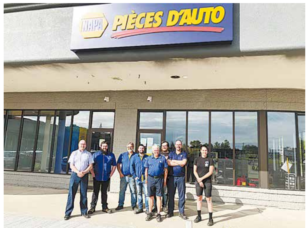
L'équipe de NAPA Pièces d'auto Rémy Ferland Inc à Sainte-Anne-de-Baupré, 10909, boul Sainte-Anne, Sainte-Anne-de-Baupré 481-827 1817