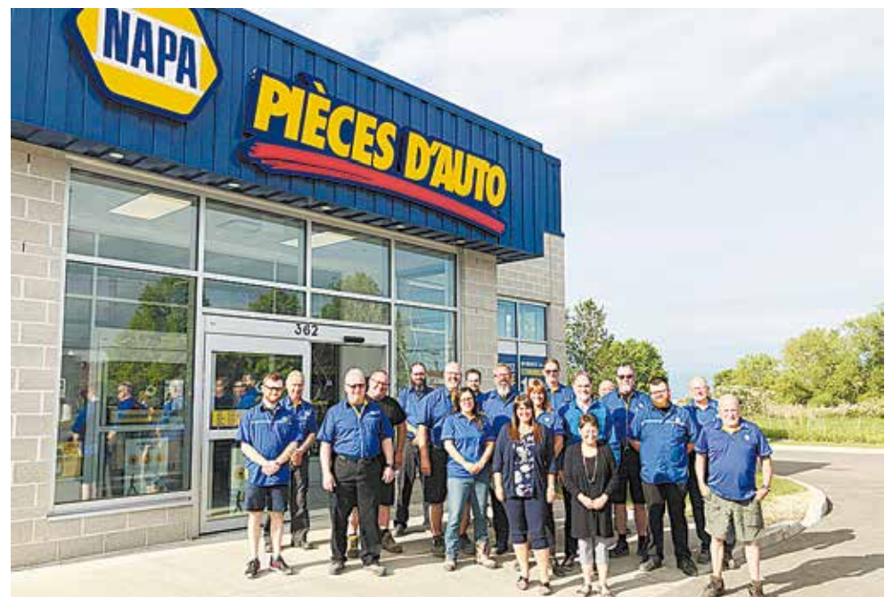
L'équipe de NAPA Pièces d'auto CPR Inc à Beauport, 362, Adanac 418-661-3711