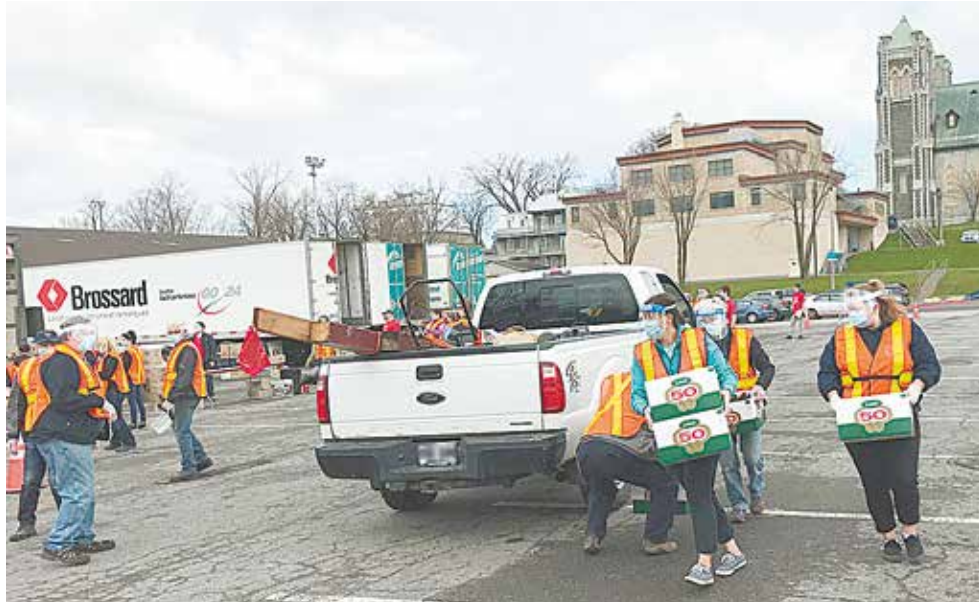
La manutention des caisses de bière s'est effectuée rondement par les bénévoles affectés à cette opération tout au long de la journée.

De nombreux commentaires positifs ont été adressés aux organisateurs par les automobilistes tout au long de la journée pour la qualité de l'aménagement du site de récupération, l'accueil et le dynamisme des bénévoles. ●