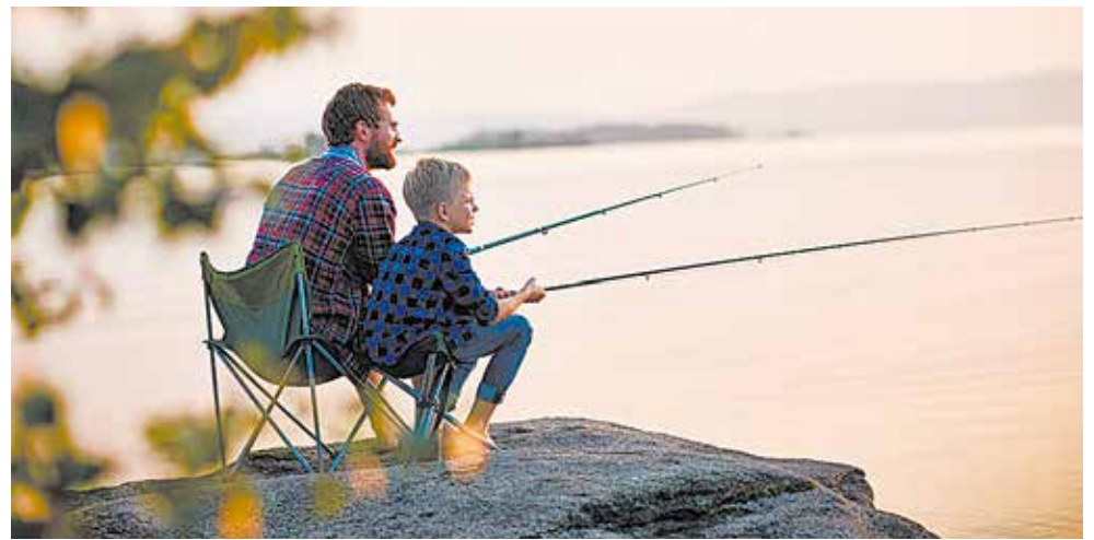
Pour que la sortie de pêche soit fructueuse, il est important de connaître les lieux où se trouvent les poissons sur le plan d'eau.

Ferrer un poisson n'est pas une technique très compliquée à maîtriser, mais elle est l'une des plus importantes. La déception peut être grande si une prise vous échappe parce que l'hameçon n'a pas bien pénétré dans la bouche du poisson. Pour éviter qu'une telle situation vous arrive, il suffit de lever votre canne d'un bon coup sec lorsque vous sentez un mouvement vif au bout de votre ligne. Le secret de la technique repose sur vos réflexes.