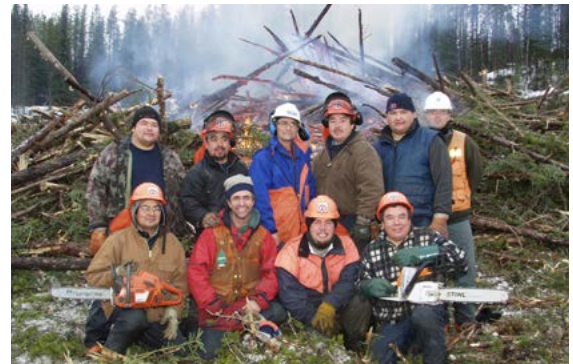
Travailleurs en foresterie au chantier de l'Eastmain-1