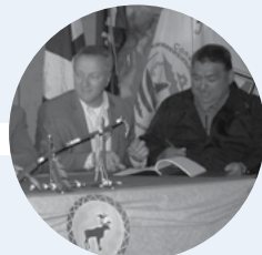
Signature de l' Entente Unamen-Pakua