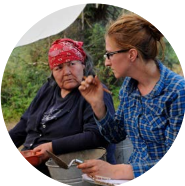
Campagne de fouilles archéologiques sur le site de la Romaine-4