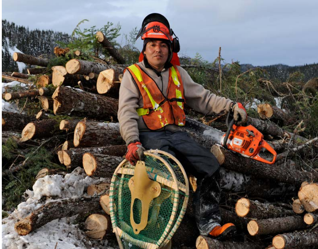
Travailleur innu sur le chantier de la Romaine