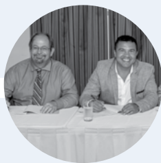
Signature de l'Entente Hydro-Québec–Atikamekw Nehirowisiw