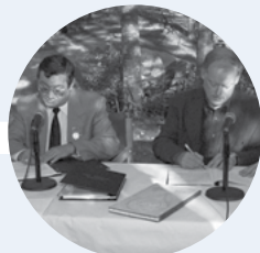
Signature de l' Entente Pesamit