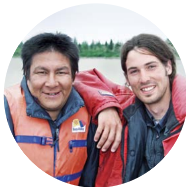
Participation active aux programmes de suivi environnemental

servant à la promotion des activités traditionnelles, entre autres en facilitant les déplacements sur le territoire, ainsi qu'à l'aménagement et à l'entretien des camps et des sentiers de motoneige