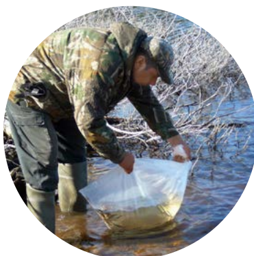
Ensemencement en esturgeons jaunes de la rivière Rupert

et de plateformes pour faciliter la pêche, de frayères, d'étangs pour la chasse, de rampes de mise à l'eau, de bases d'hydravions et d'aires de stationnement