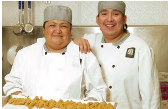
Employés autochtones au chantier de l'Eastmain-1