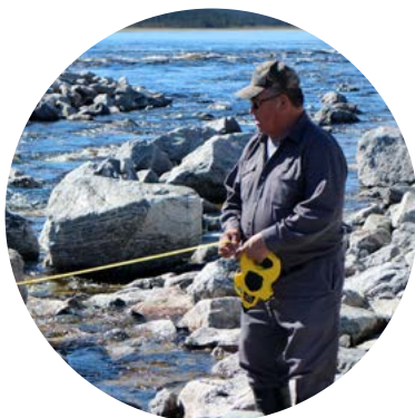
Suivi de la fraie des esturgeons jaunes dans la rivière Rupert

et construction de seuils dans les rivières pour favoriser la navigation et les activités de pêche ainsi que préserver les habitats aquatiques