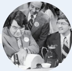
Signature de la Convention de la Baie-James et du Nord québécois