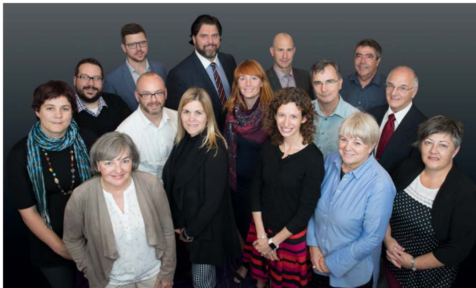
La majeure partie de l'équipe Relations avec les autochtones

Une équipe de conseillers, formés dans des domaines très variés comme la biologie, l'anthropologie, le droit et la géographie, se consacre quotidiennement à l'établissement et au maintien de bonnes relations avec les autochtones sur tout le territoire. Certains y travaillent depuis plus de 20 ans. Ces spécialistes assurent une présence constante auprès des communautés et entretiennent une communication continue avec elles, en plus de négocier les ententes, d'en assurer la mise en œuvre et d'en faire le suivi.