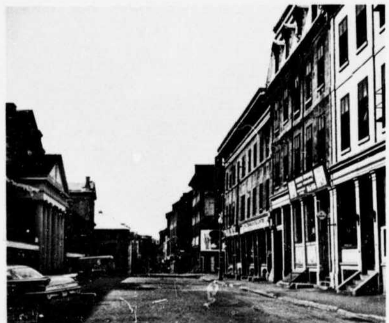
Rue St-Paul dans le Vieux Montréal St. Paul Street in Old Montreal

Montréal tire son nom de Mont-Royal ou Mont-Réal, le nom donné à cette élévation par Jacques Cartier, qui a découvert Hochelaga en 1535, l'année de son exploration du fleuve Saint-Laurent, probablement jusqu'au rapide qu'on appelle aujourd'hui Lachine. La montagne, de 769 pieds de hauteur, s'élève majestueusement au milieu de l'île qui est la plus grande du groupe d'îles formées par la rencontre de la rivière Ottawa et du fleuve Saint-Laurent. Cette île a 30 milles de longueur, 7 à 10 milles de largeur et une superficie de 194 milles carrés. La ville actuelle couvre plus de 43,734 acres ayant, par annexion, surtout en 1883, grandi de 5,000 acres qu'elle était en 1860. Sa superficie de 68 milles carrés occupe un quart de l'île.