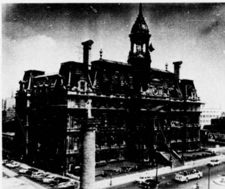
Montreal City Hall, Notre Dame Street West Hôtel de Ville de Montréal, rue Notre Dame ouest

Montreal's name comes from Mont-Royal or Mont-Réal, the title given this height by Jacques Cartier, who discovered Hochelaga in 1535, the year he explored the St. Lawrence River probably as far as the rapids, now called Lachine. Mont-Royal mountain, 769 feet high, stands nobly in the middle of an island, which is the largest of the group of islands formed by the confluence of the Ottawa and St. Lawrence Rivers. This island is 30 miles long and 7 to 10 miles wide, with an area of 194 square miles. The present City covers over 43,734 acres, having, by annexation, especially in 1883, grown from the 5,000 acres of 1860. It occupies one-quarter of the island and is 68 square miles in area.