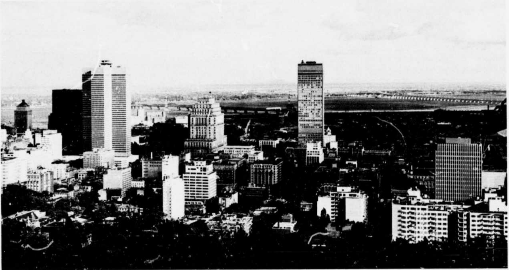
General view of Montreal from Mt. Royal