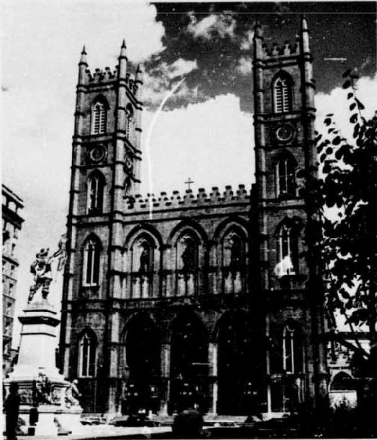
Notre Dame Church, Place d'Armes Eglise Notre Dame, Place d'Armes