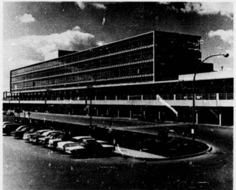
Aéroport International de Montréal, Dorval

La ville, à la fin de la lutte entre la France et l'Angleterre pour la suprématie de l'Amérique du Nord, capitula le 8 septembre 1760. Pendant la révolution américaine, la ville resta entre les mains des troupes du Congrès depuis la capitulation le 13 novembre 1775 jusqu'à son évacuation par Benedict Arnold en juin 1776. A partir de ce moment, le commerce commença à se développer: la compagnie du Nord d'Ouest, traiteurs, s'établit à Montréal en 1783-4, la "X.Y." en 1795-1804, et