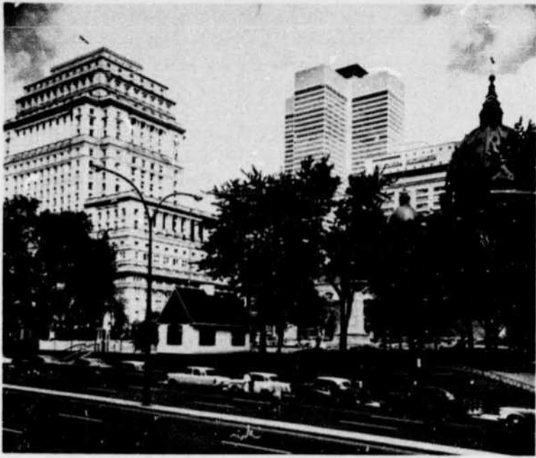
Place du Canada