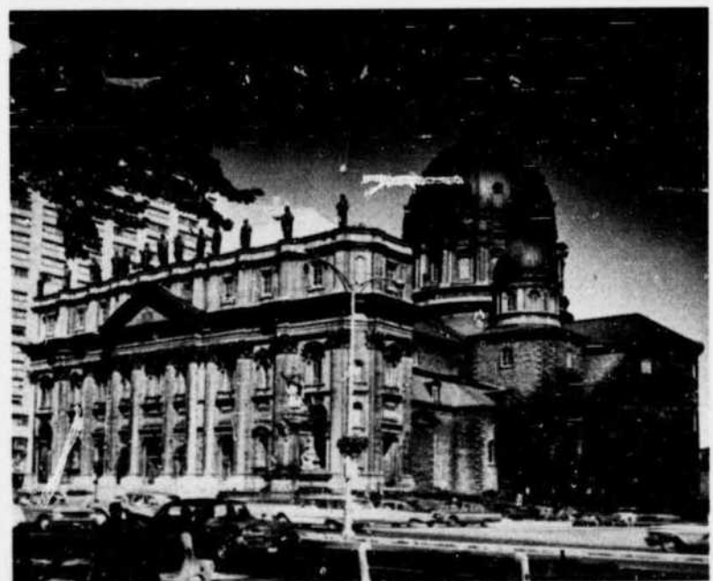
Cathédrale Marie Reine du Monde, boulevard Dorchester ouest Basilique Cathédrale Marie Reine du Monde, Dorchester Blvd West

L'autoroute panoramique des Laurentides, commencée en 1956 et terminée en 1960 jusqu'à Saint-Jérôme, part de Montréal à la sortie 17 du boulevard métropolitain, relie Montréal