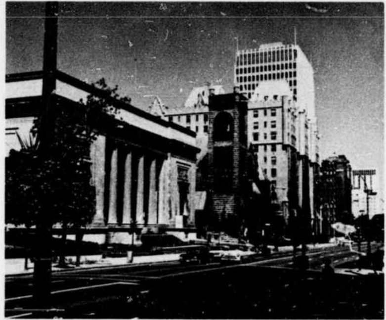
Montreal Museum of Fine Arts, Sherbrooke Street West Musée des Beaux-Arts de Montréal, rue Sherbrooke ouest

à l'Ile-Jésus, traverse la rivière des Mille-Iles jusqu'à Rosemere, puis se rend à Ste-Adèle. C'est une voie divisée avec quatre postes de péage, 67 ponts et croisements pontés.