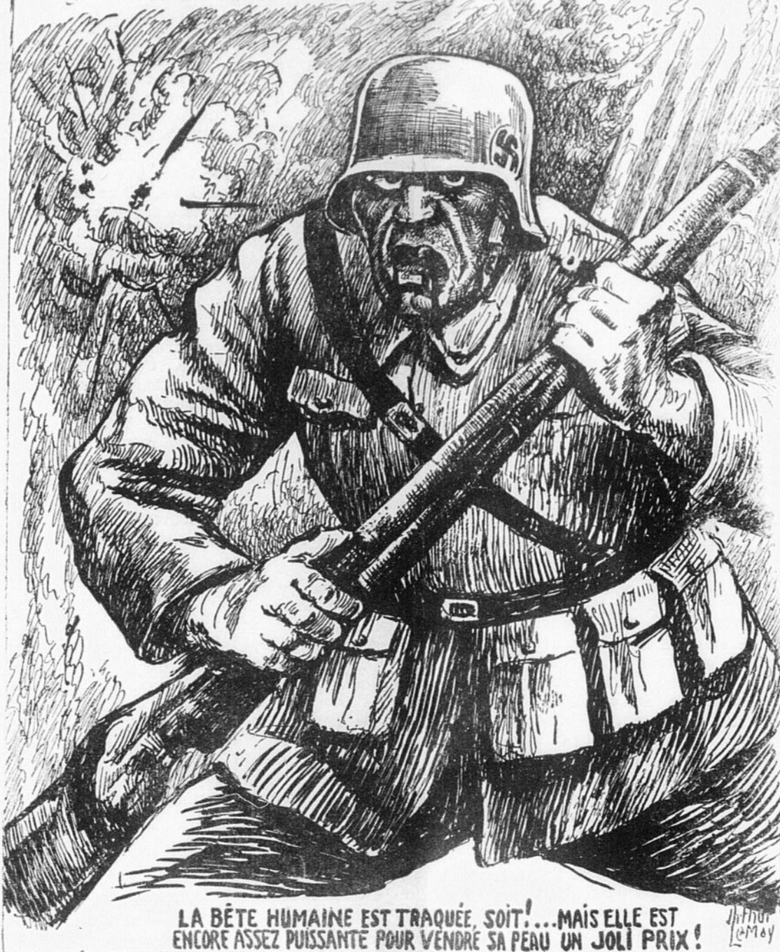
LA BÊTE HUMAINE EST TRAQUÉE, SOIT!... MAIS ELLE EST ENCORE ASSEZ PUISSANTE POUR VENDRE SA PEAU UN JOLI PRIX!