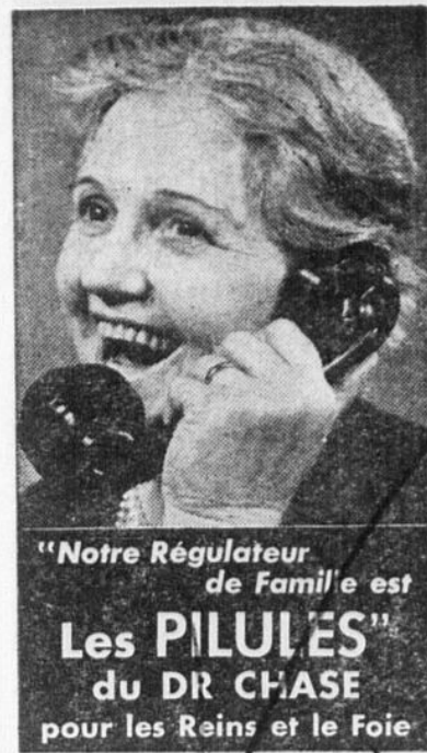
"Notre Régulateur de Famille" est Les PILULES du DR CHASE pour les Reins et le Foie