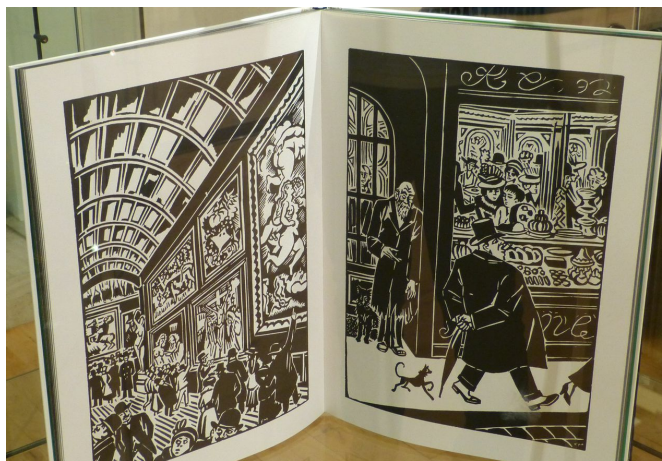
Exhibit: Ibrahim Müteferrika and Ottoman Incunabula , à l'Université McGill, Jusqu'au 31 juillet 2015

La Bibliothèque Wittokiana , le seul musée de la reliure et des arts du livre tient actuellement une exposition très intéressante des œuvres de l'illustrateur et maître graveur belge Frans Massereel (1889-1972). Cet événement retrace une quinzaine d'années de la carrière de l'un des plus remarquables artistes belges du XXe siècle. Nous pouvons y admirer de nombreux dessins et gravures ainsi que des livres de l'artiste tel que: Mon livre d'heures , 167 dessins et gravures sur bois et La Ville , livre composé de cent gravures. Frans Massereel a aussi travaillé à illustrer plusieurs livres d'écrivains connus comme Georges Duhamel, Romain Roland et Stefan Zweig. Cette exposition se poursuit jusqu'au 1er mars 2015. Un artiste à découvrir pour ceux et celles qui auront la chance de passer par Bruxelles.