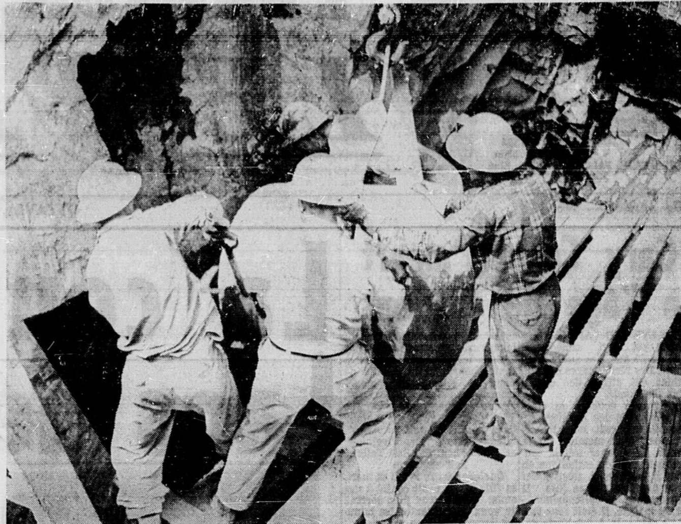
LE COULAGE DU BETON — Cette photo fait voir une autre étape dans la construction du tunnel d'égouts de Sudbury. Les employés effectuent le coulage du béton à l'intérieur du tunnel au moyen d'un immense récipient en métal que véhicule une grue mécanique.