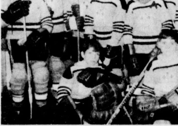
PEE-WEE CHAMPLAIN — L'équipe Champlain de la division Pee-Wee du hockey mineur représentera Victoriaville lors du tournoi provincial disputé à Donnacona, en fin de semaine.

Voilà le message que le service d'orientation du CEGEP vient de transmettre à tous les étudiants, par l'entremise du bulletin hebdomadaire.