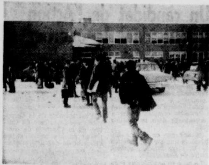
LES ELEVES évacués dans l'ordre attendent que les sapeurs aient maîtrisé les flammes.