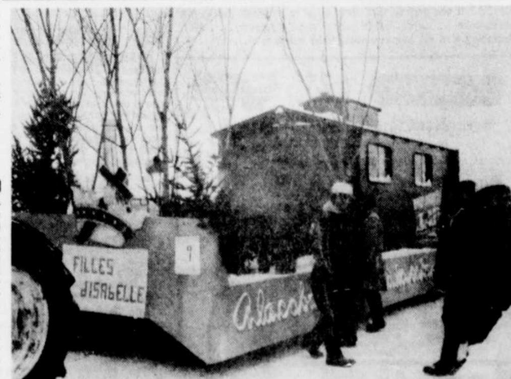
Le char allégorique des Filles d'Isabelle représentait une scène pittoresque de la cabane à sucre.

Parmi les activités de cette journée de clôture, mentionnons une parade dans les rues de la ville, l'avant-midi. Cette parade comprenait quatre chars ayant pour thème les sports, l'école, les courses de motos-neige, et enfin, les duchesses. L'après-midi, il y eut une course de motos-neige suivie de la projection d'un film intitulé "Warwagon", et un spectacle de variétés.