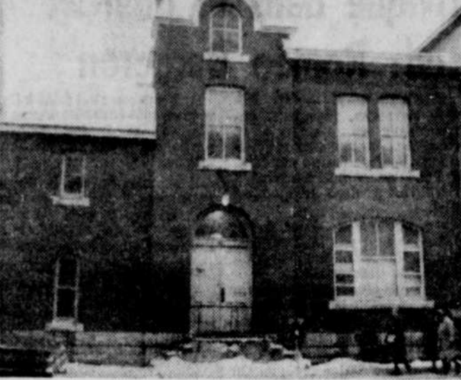
FERMETURE? — Selon une récente déclaration du ministre fédéral de la Défense, le manège militaire de Thetford Mines fermerait ses portes le 1er avril prochain, et le 15ème escadron de génie serait dissout. Cette nouvelle est loin de faire l'unanimité dans les rangs de l'Unité de réserve, qui exerce des pressions sur Ottawa pour faire annuler cette décision. La photo ci-haut illustre les quartiers généraux du 15e escadron de génie de Thetford, lequel compte un demi-siècle d'existence. On voit par ailleurs que le conseil de ville a les yeux sur cette bâtisse pour loger la future bibliothèque municipale.