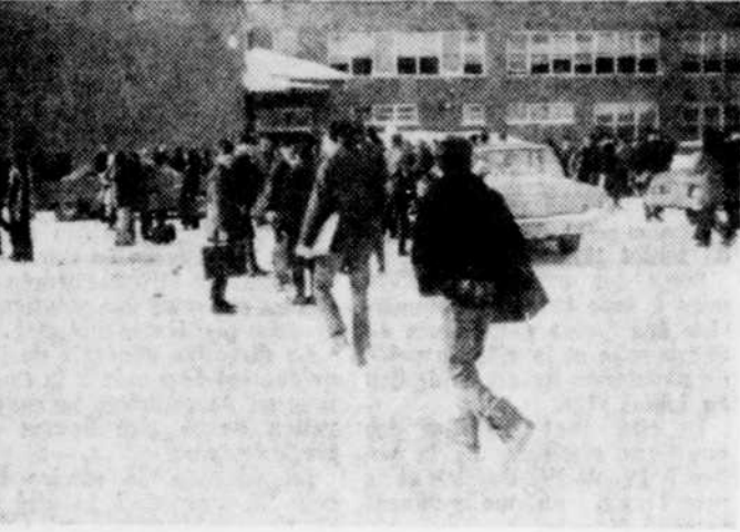
LES ELEVES évacués dans l'ordre attendent que les secours aient maîtrisé les flammes.