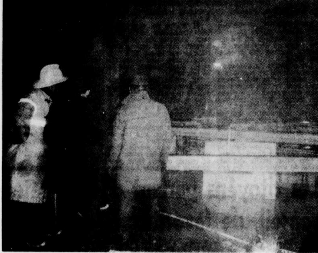
L'intérieur de la grande salle a subi de lourds dommages.

Causes — Les causes de l'incendie ne sont pas encore connues et une enquête est en cours pour découvrir les sources exactes du sinistre. La possibilité que le circuit électrique soit à la base de l'incendie a été écarté par la confirmation d'experts.