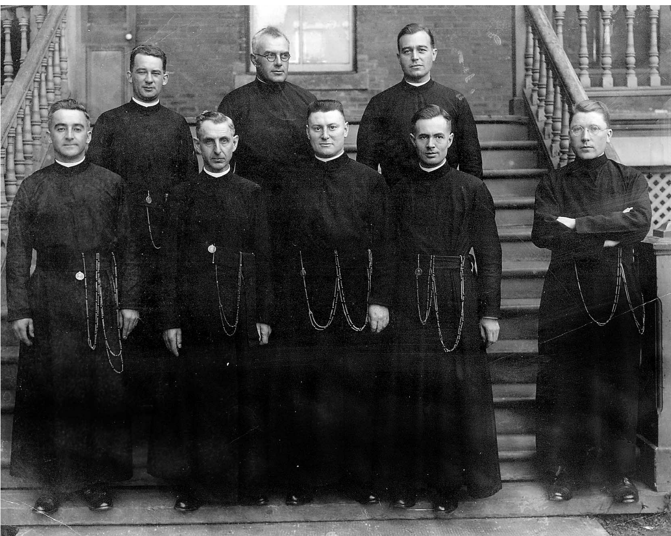
Perçus par certains comme les bâtisseurs du Québec, huit prêtres jésuites ont posé pour la postérité en 1935.