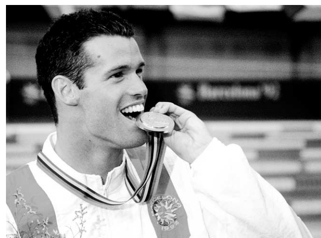
L'ex-nageur olympique Mark Tewksbury.

got Wallstrom, commissaire à l'Environnement, soulignant que de nos jours, « les consommateurs sont de plus en plus exigeants dans leur recherche de vacances plus écologiques ». Pour obtenir l'écolabel, l'opérateur touristique doit satisfaire à des critères minimaux en matière environnementale et sanitaire : recours à des sources d'énergie renouvelables, réduction globale de la consommation d'énergie et d'eau et mesures pour réduire les déchets.