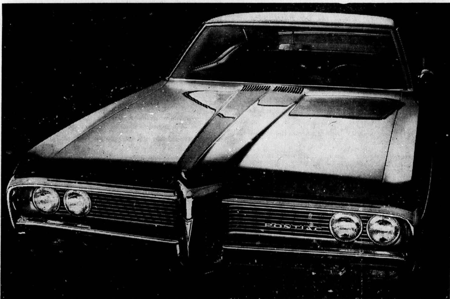
Le coupé sport Pontiac Parisienne

Au volant d'une Pontiac à voie large. Ça ne coûte pas plus cher qu'une voiture ordinaire. A votre choix: 24 modèles. Tous vous offrent la conduite à voie large, une exclusivité de Pontiac. Que ce soit le 6-cylindres de 250 po. cu. ou le V8 de 327 po. cu., tous deux équipement standard de la Pontiac. Roulez à voie large. Roulez dans une Pontiac. C'est le temps d'en mener large. Et passez voir le concessionnaire Pontiac. La Pontiac.