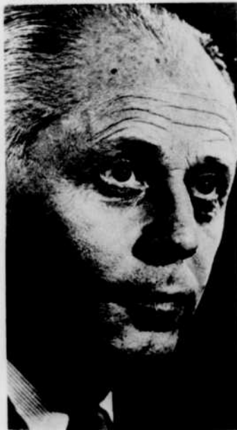
Docteur Hans Selye

canadien reconnu pour ses recherches sur le stress.