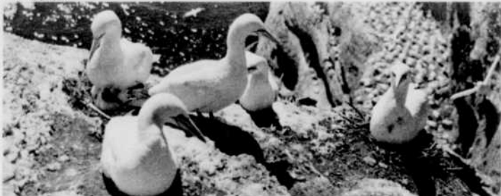
Ici et là