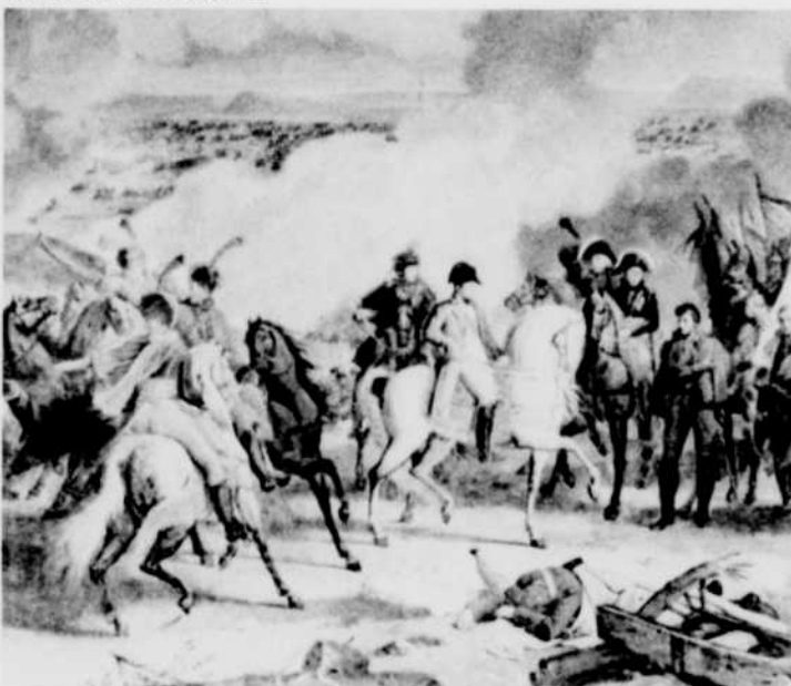
La Bataille d'Austerlitz

Comme pour les autres émissions, des témoins, c'est-à-dire des passionnés de cette tranchée d'histoire, ont été réunis. Il est fait également usage d'extraits de films comme «Guerre et Paix», etc.