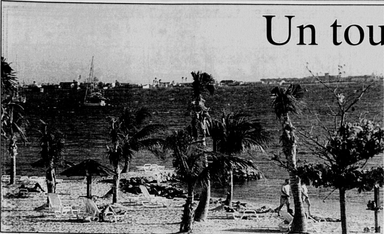
Si les belles plages de Saint-Martin n'abondent pas sur les rives de la Baie Nettlé, c'est en revanche ici qu'on trouvera le plus grand choix d'hôtels à moyen et grand budget.