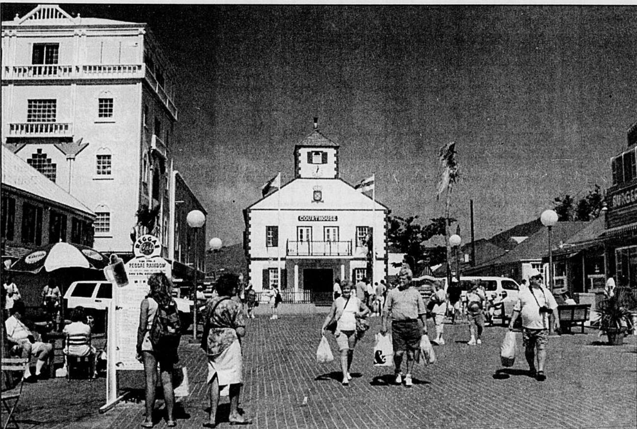
Philipsburg, capitale de la partie néerlandaise, semble n'exister que pour et par le tourisme de croisière.

Bien malin sera l'étranger qui se rendra compte qu'il change de pays