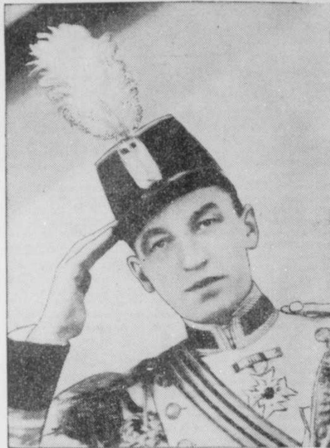
LIONEL DAUNAIS qui tiendra le rôle-titre du "Soldat de Chocolat" aux Variétés Lyriques.