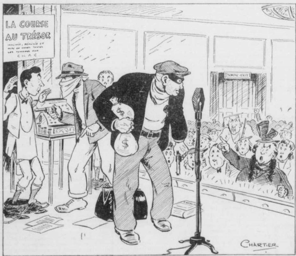
"Aye! Pas si vite, vous autres! Je parie que vous n'avez même pas d'étiquette de gomme à mâcher P.K. sur vous!"