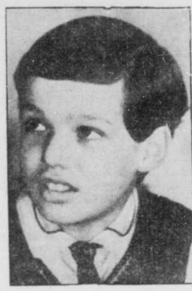
ANDRÉ MATHIEU, jeune pianiste et compositeur canadien, de 11 ans, dont le talent mérite de s'épanouir dans un milieu favorable à tous les points de vue.

bien rare de ne pas la rencontrer à tout propos dans quelque entreprise que ce soit. C'est une cabale continuelle, alimentée de faussetés et d'allégations fautive dont il reste malheureusement toujours quelque chose. Les hommes publics eux-mêmes, incapables de vérifier tout ce qu'on chuchote autour d'eux, connaissent bien rarement la valeur des hommes et la vraie situation des choses. On procède par ce que l'on pourrait appeler la calomnie fermée. On avance une monstruosité sous la garantie expresse que l'écouter devra garder le secret absolu et ne jamais en parler. La moindre apparence de preuve prend alors figure de confirmation et voilà une situation à jamais insoluble, parfois une condition à jamais compromise. Dans le domaine de la musique, les propensions à l'envie s'accroissent d'une susceptibilité exagérée, toujours en éveil, alimentée par des soupçons souvent erronés qu'une imagination vive se forge à tout propos. De plus, la profession n'étant pas organisée, les échecs ne manquent pas aux plus talentueux... Ils glissent insensiblement dans l'aigreur et deviennent une proie facile pour les ressentiments incurables. La certitude pénible que d'autres vont aller plus loin que soi, avec peut-être moins