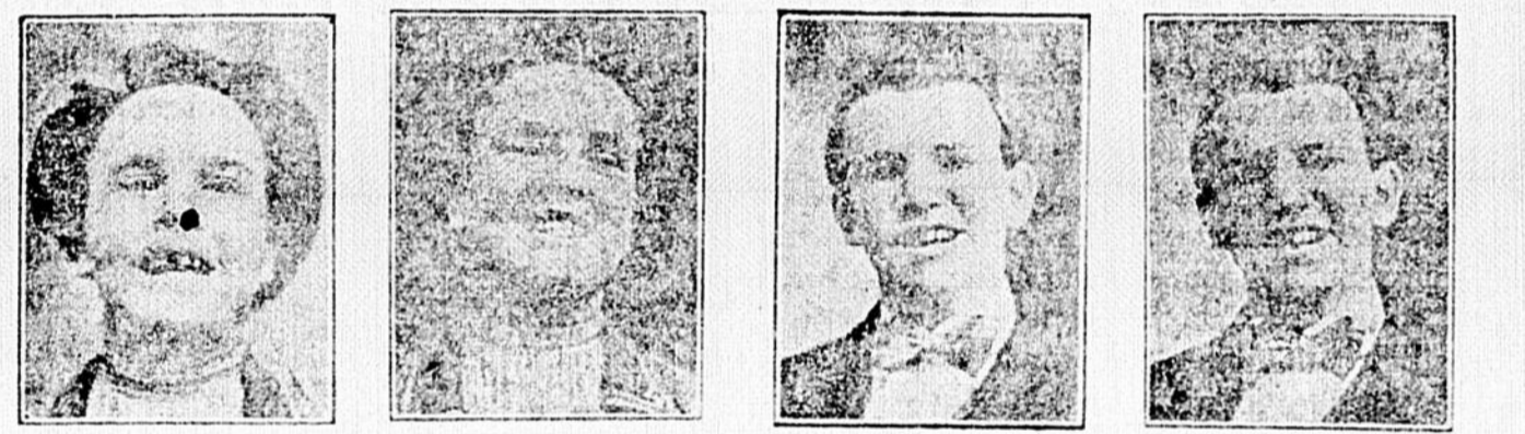
Remarquez ces jeunes personnes avec leurs mauvaises dents (à gauche) et remarquez leurs figures épanouies après qu'elles furent traitées, soignées, sauvées par le dentiste.

Trop de monde malheureusement ne connaît pas les bienfaits d'une parfaite dentition. L'HYGIENE DENTAIRE est de nécessité PRIMORDIALE. Les mauvaises dents sont la cause d'une foule de maux. On a découvert dans les mauvaises dents les microbes de la fièvre typhoïde, de la tuberculose et de la PARALYSIE INFANTILE. TRENTE-DEUX BONNES DENTS, CE SONT TRENTE-DEUX MEDECINS QUI VOUS SOIGNENT. Si vous voulez avoir une BONNE DIGESTION, ayez de BONNES DENTS. L'ART DENTAIRE a fait des PROGRES CONSIDERABLES depuis vingt ans. AUJOURD'HUI, on pose LES DENTS SANS PALAIS. AUJOURD'HUI, on extrait les dents sans douleurs. AUJOURD'HUI, on pose des dentiers qui remplacent à s'y tromper les dents naturelles. AUJOURD'HUI, il n'est plus nécessaire de se faire extraire les dents. ON LES TRAITTE, on les soigne et on les guérit et cela SANS DOULEUR.