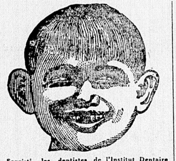
Sapristi, les dentistes de l'Institut Dentaire ne m'ont pas fait mal du tout... du tout.

Hommes, Femmes et Enfants Consultez nos Dentistes experts