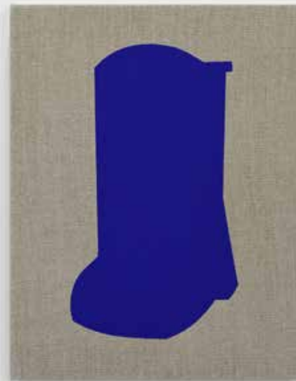
© Daniel Langevin, CM (395304-LN/UM) , 2017. Photo : Daniel Langevin

Le titre de l'exposition fait écho au principe mathématique de la « somme vide », soit l'addition de zéro, c'est-à-dire rien, comme si l'abondance d'options sur le Web contribuait moins à diffuser et à faire circuler l'information qu'à brouiller les pistes.