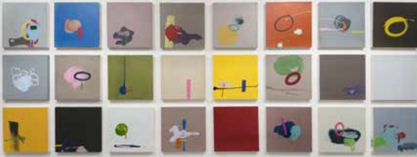
© Guylaine Chevarie-Lessard, Espace du dedans IV , 2016.