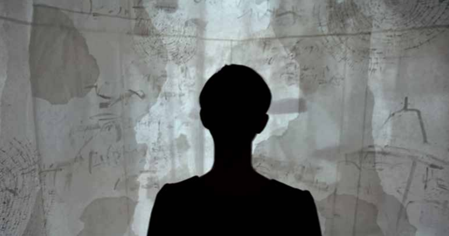
© Lisa Tognon, Chant d'ombre , 2016.