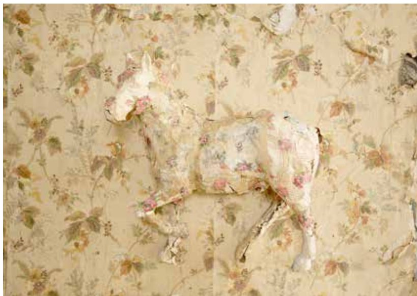
© Luce Pelletier, Cheval de trait blond, 2016

Réunissant des photographies et quelques objets sculpturaux, Luce Pelletier nous invite à découvrir un univers où l'identité et l'expression de la mémoire individuelle et collective sont habilement exprimées à travers le papier. Pour confectionner ces objets, l'artiste a utilisé de vieux papiers peints qu'elle a retirés des murs d'une maison abandonnée de Charlevoix. À la manière de memento mori , ces artefacts fragiles participent à la symbolique du temps qui passe. Ainsi, par un recyclage d'images et de matériau, Luce Pelletier tente de traduire l'esprit de la vie en milieu rural et l'espace domestique du siècle passé. Ce travail amorce une réflexion sur nos valeurs, nos traditions ainsi que la place des femmes longtemps occultée de notre histoire.