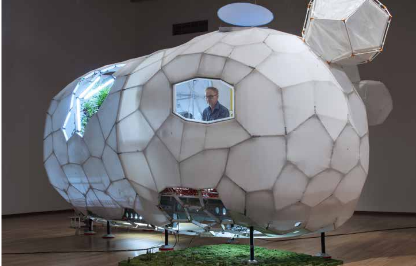
© Daniel Corbeil, Module de survie , 2017.