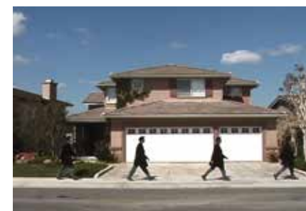
© Henry Tsang, Orange County, 2004