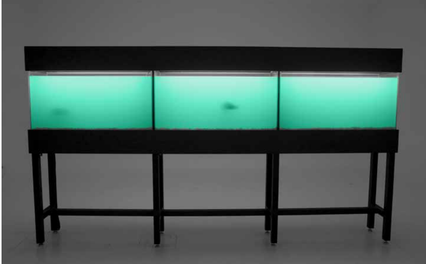
© CIRCA 2018, Karine Payette, À perpétuité