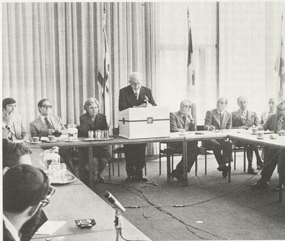
Photo de la table officielle lors de l'Assemblée relative aux écoles juives privées.

En d'autres termes, l'auto-évaluation a pour but de fournir aux différentes personnes impliquées dans la vie d'une institution (personnel enseignant, administrateurs, élèves, parents, etc) une idée plus précise de ce que celle-ci devrait être pour atteindre ses objectifs: la réflexion collective provoquée à l'occasion de cette opération permet d'évaluer concrètement le rendement de chacun de ses rouages, d'en identifier positivement les aspects à améliorer pour atteindre les buts fixés.