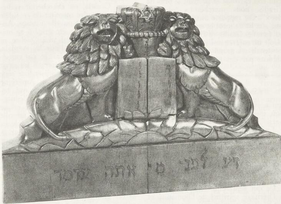
Sculpture ancienne sur bois de teck provenant de la Communauté Juive de Birmanie et représentant deux lions de Juda soutenant les Tables de la Loi, ainsi qu'une Couronne surmontée de l'Etoile de David.