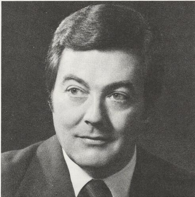
Hon. Jean Bienvenue Ministre de l'Immigration du Québec

A l'occasion du Nouvel An 1974, je suis heureux d'offrir à tous mes concitoyens Juifs mes meilleurs voeux de bonheur et de prospérité.