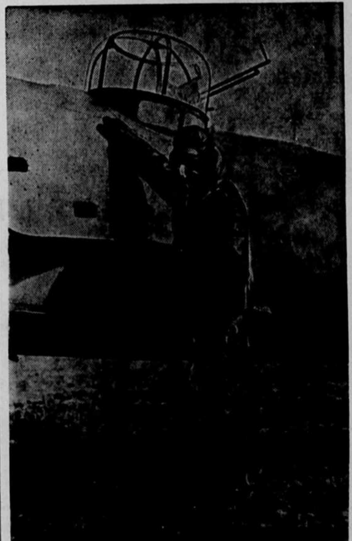
Un pilote de la Royal Air Force, équipé pour une envolée de grande altitude, monte dans son avion pour se rendre au-dessus de l'Allemagne.