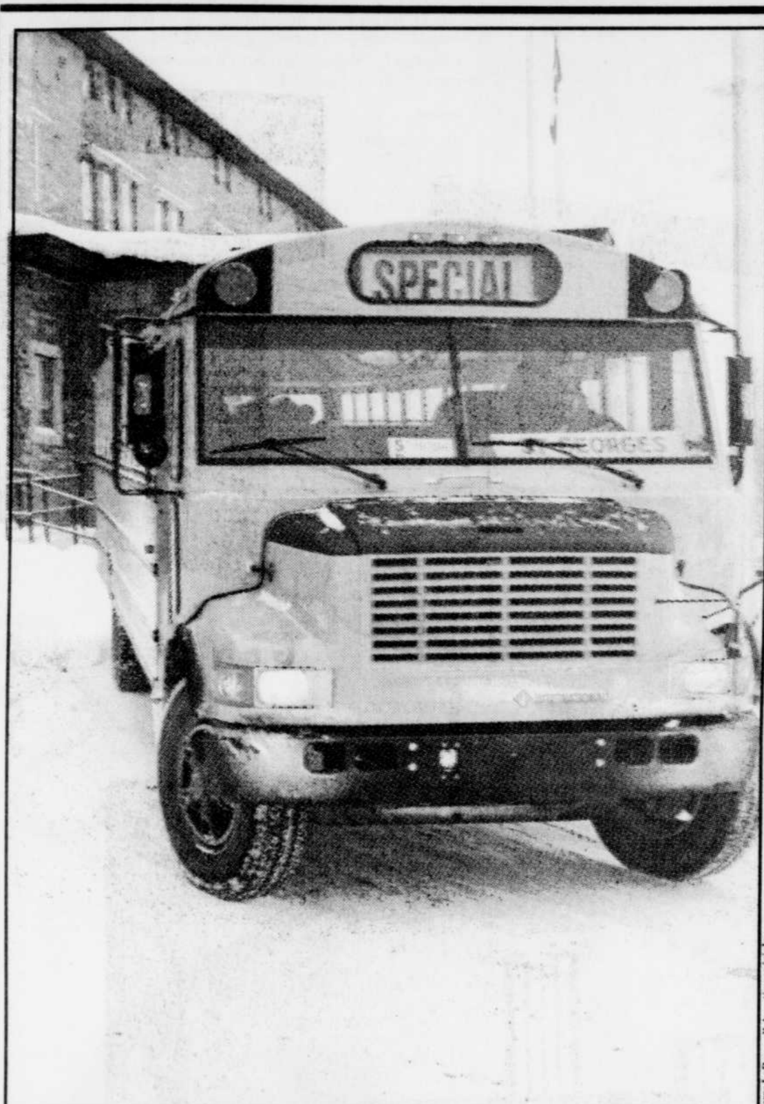
Les « autobus jaunes » ne sont utilisés pour le transport en commun qu'à titre provisoire à Baie-Comeau.

L'échéancier d'Hydro prévoit la mise en service de la nouvelle centrale en 1994.