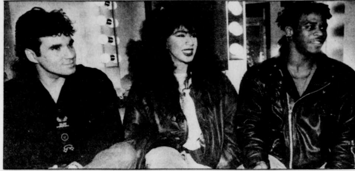
Se considérant comme des ambassadeurs de leur pays, Malagoti, Monica et Edson déclarent ne pas se lasser, représentation après représentation, de propager la culture brésilienne.

membres d'Oba Oba, il s'agit des plus beaux métiers du monde.