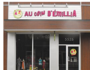
Au Coin d'Émilia