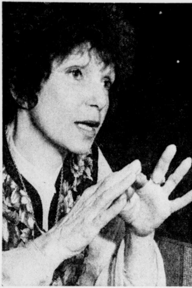
Monique LEYRAC

Monique Leyrac qui durant toute sa carrière a interprété merveilleusement bien tous les grands de la chanson, ajoute une nouvelle corde à son arc en devenant auteur-compositeur.