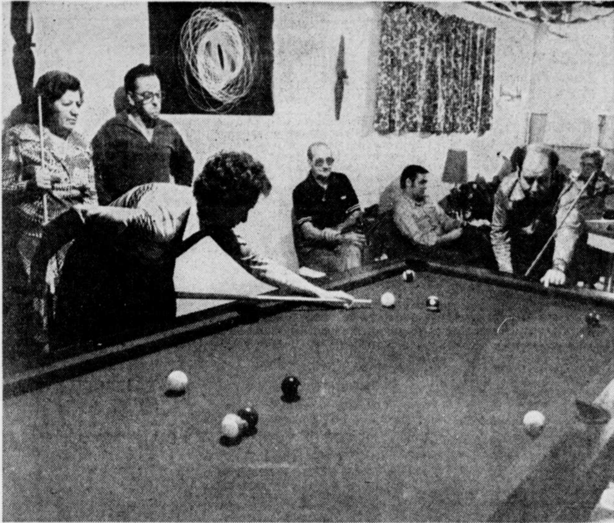
Le Soleil, Jean Vallières

Les dames ont repris du poil de la bête au billard. Avec le résultat que les hommes se font parfois malmener.