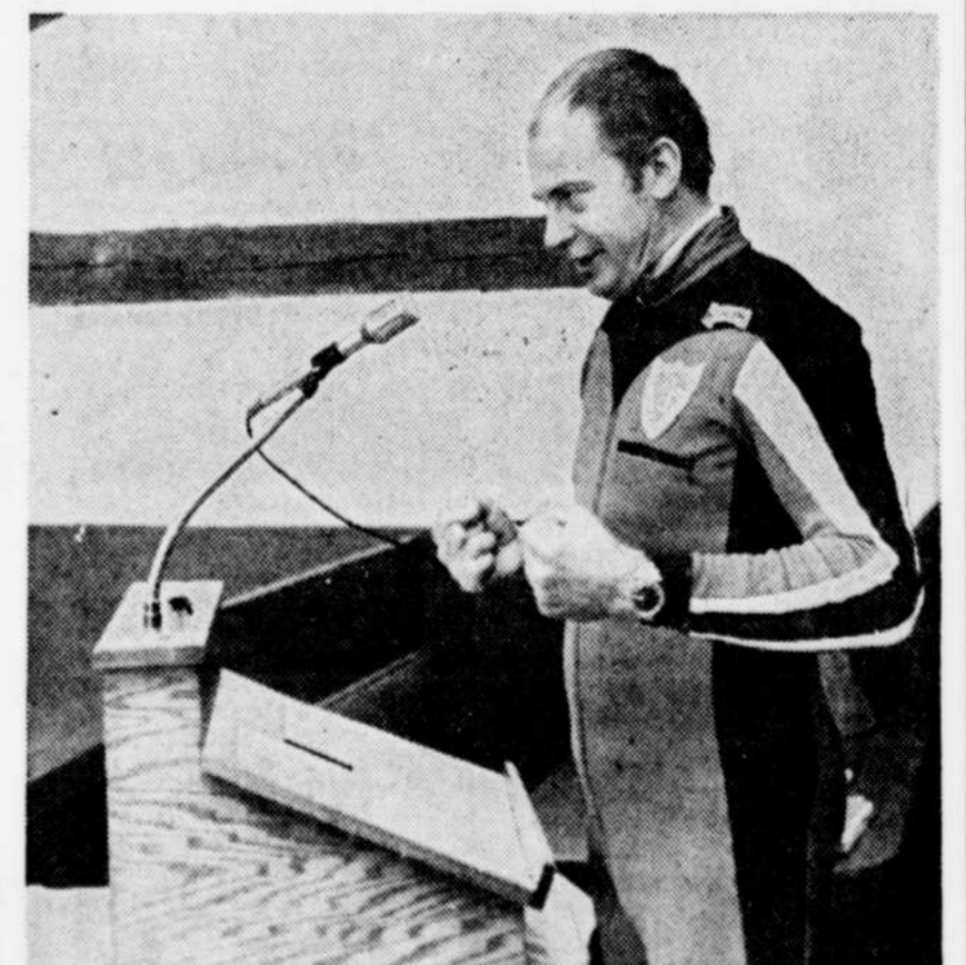
Le Soleil, André Boucher

Et ceux qui croient que c'est utopique n'ont qu'à penser aux pas de géants accomplis ces dernières années dans le développement du ski de fond dans la région.