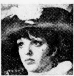
Liza Minnelli dans une scène du film "Cabaret"