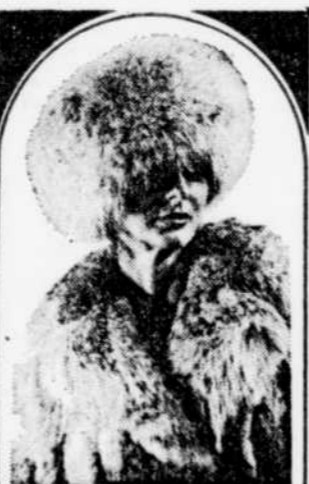
REINE DE LA QUALITÉ

Les statistiques concernant les arrêts de travail portent sur les travailleurs non agricoles.