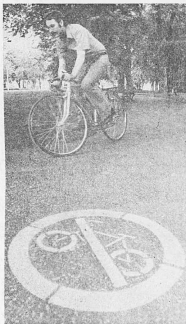
Au p'tit matin, personne ou presque au parc Lafontaine. Les bicyclettes sont interdites. Bof! Tout le monde ferme l'oeil ou n'est pas encore éveillé.

Il n'a pas de plaque d'immatriculation. "Tiens, j'avais pas remarqué que je l'avais perdue".