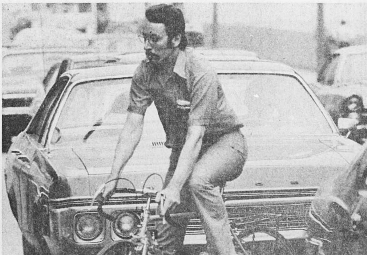
... Dans quel pétrin je me suis mis? Il faut que je m'en sorte sans accident. Je suis intelligent, prudent, vaillant, il n'y aura pas de problème!