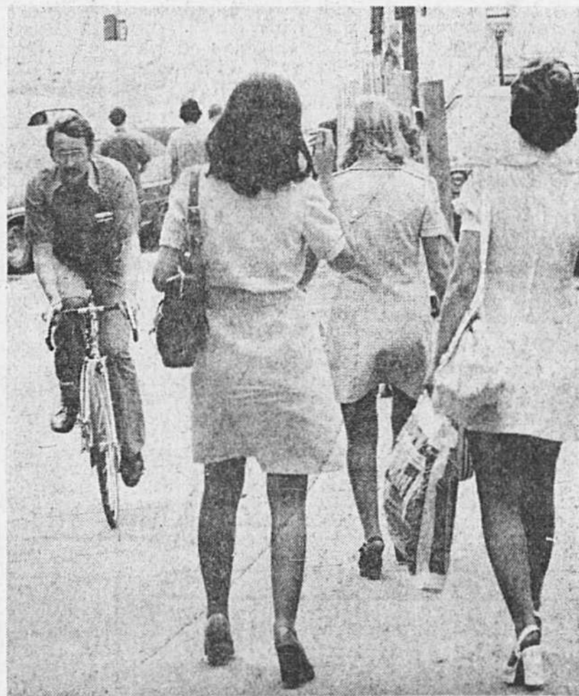
Sur le trottoir, la circulation est dense mais les rencontres sont plus agréables. Et puis... c'est défendu!