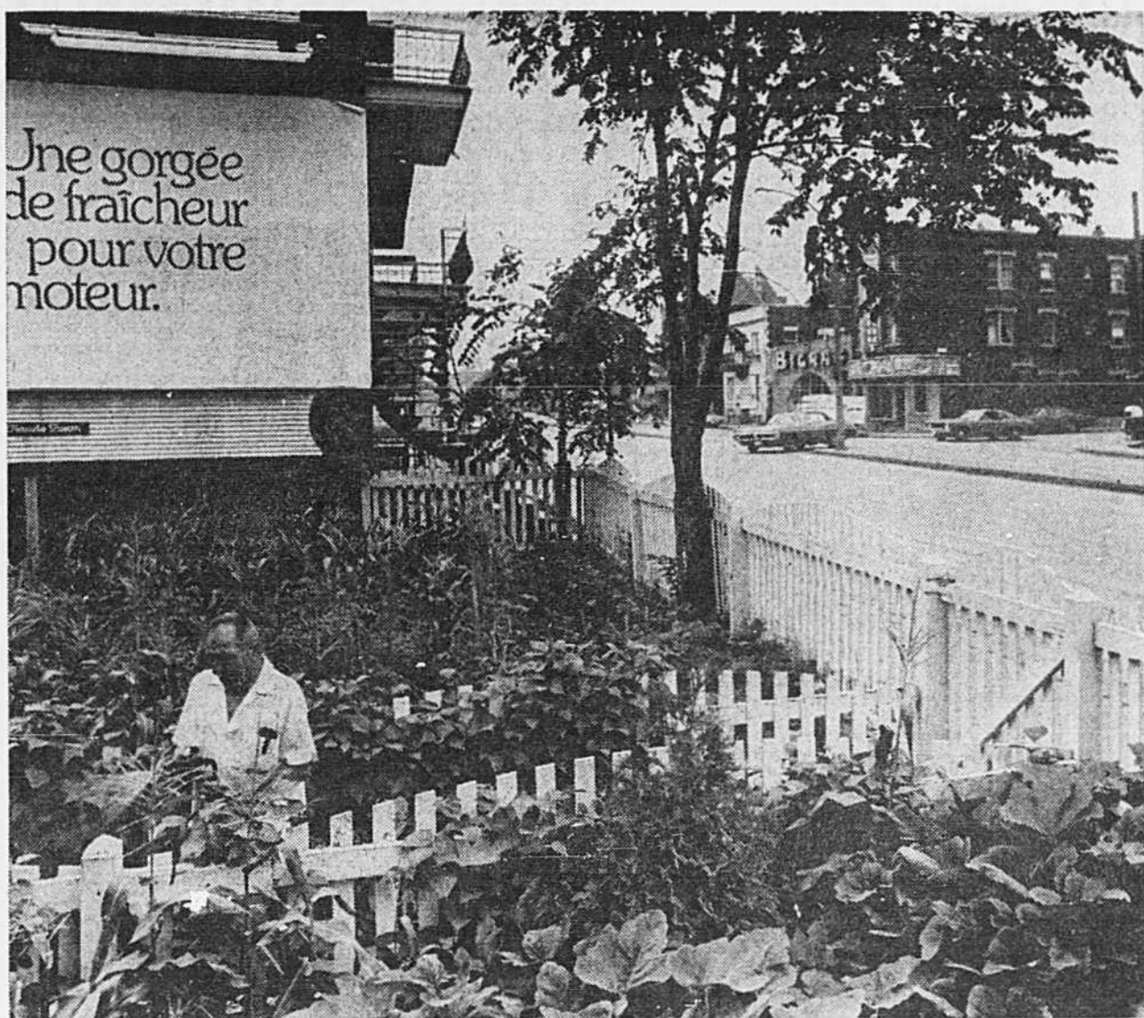
"Moi, je suis pour les espaces verts... et les Olympiques aussi."

Si vous passez devant la petite clôture blanche au 4268, Hochelaga, vous verrez sans doute un petit homme trapu qui regarde pousser ses plants de tomates en pensant qu'il n'y a pas si longtemps il pouvait chasser les grenouilles de l'autre côté de la rue. La ville a grandi. Dans quelques années, il n'y aura plus ni clôture blanche, ni vignes, ni plants de tomates mais peut-être un beau bloc tout neuf.