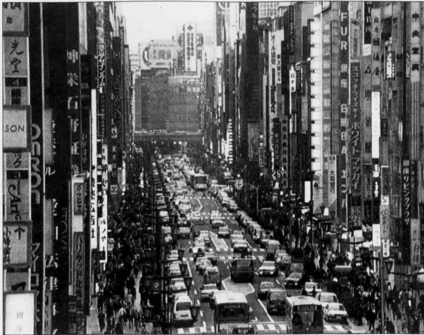
Les représentants du G-7 se réunissaient en juillet dernier à Tokyo. Les 110 pays membres du GATT devront trancher dans plusieurs dossiers qui seront déterminants pour l'avenir du système commercial international.

L'importance des dossiers négociés à l'Uruguay Round entraîne nécessairement une implication significative des gouvernements de chaque pays membre. Il devenait