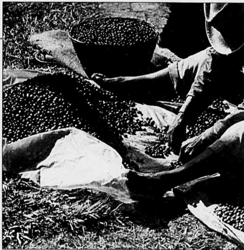
La caféine et le sucre aggraveraient la fatigue.

Mais Bernard Fortin croit que le gouvernement de Québec est à la mesure de l'intérêt accordé aux services de garde. «Lorsqu'il manque des places dans les cégeps, comme on l'a vu l'an dernier, on en crée. Argent ou pas. Ça devrait être la même mentalité qui régit les services de garde à la petite enfance.»