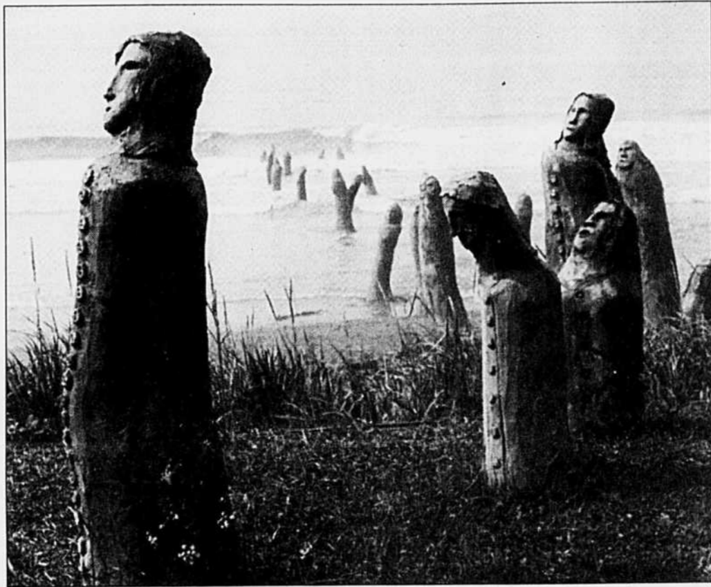
Le grand rassemblement de Marcel Gagnon, à Sainte-Flavie: 80 personnages de ciment et de béton, littéralement sauvés des eaux et à la recherche de la lumière. «Une oeuvre unique au monde qui attire plus de 100 000 visiteurs chaque été», dit son créateur.