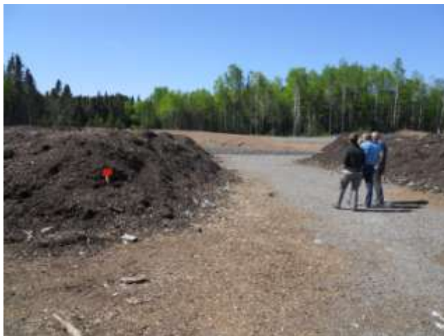
Sur le terrain, déchiqueté et daté, le compost mature