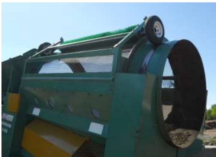
Le tamis cylindrique

Après une première transformation, on déplace le tas à l'extérieur, on le déchiquette, le date, et laisse la maturation se compléter. Dans cette zone extérieure, des canaux recueillent encore le liquide émis, toujours pour traitement. Les tas sont encore retournés de temps à autre. Une fois le compost mature, il est tamisé, puis testé en laboratoire pour en vérifier la qualité. Il est ensuite utilisé ou proposé comme engrais.