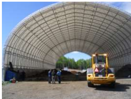
L'abri géant où on accueille les matières organiques

Le suivi des ICI est tel que la Régie sait très bien qui sont ceux qui se sont vraiment améliorés, réduisant notablement leur quantité de déchets voués à l'enfouissement. À ceux-là, une belle surprise les attend : leur facture de taxe diminue!