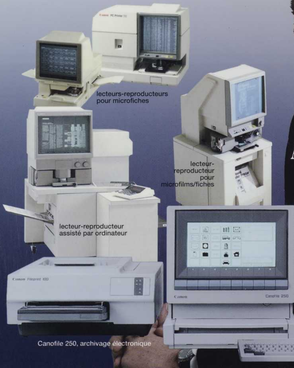
lecteurs-reproducteurs pour microfiches

Notre expertise (archivage électronique et micrographie) nous permet de trouver une solution globale, sur mesure. Notre gamme de produits variée et mondialement reconnue peut mettre en valeur vos documents.