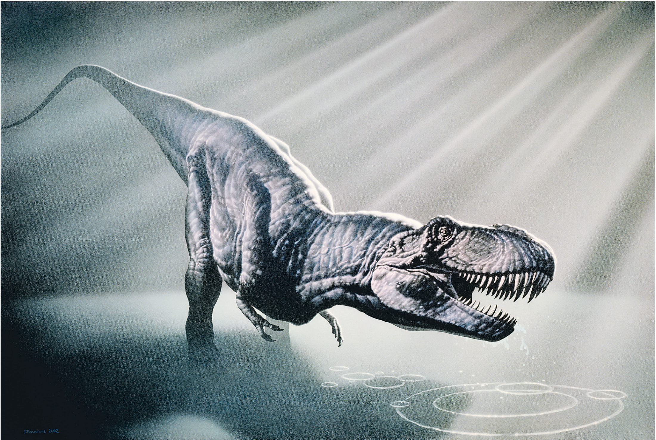
ILLUSTRATION JOE TUCCIARONE. COLLABORATION SPÉCIALE

La géologie des Dakota rend les fossiles qu'on y trouve particulièrement précieux dans le débat sur les moeurs du tyrannosaure. Cet environnement où l'eau constituait un milieu important permet d'évoquer l'hypothèse d'une alimentation à base de poissons ou de crocodiles pour le roi des carnassiers.