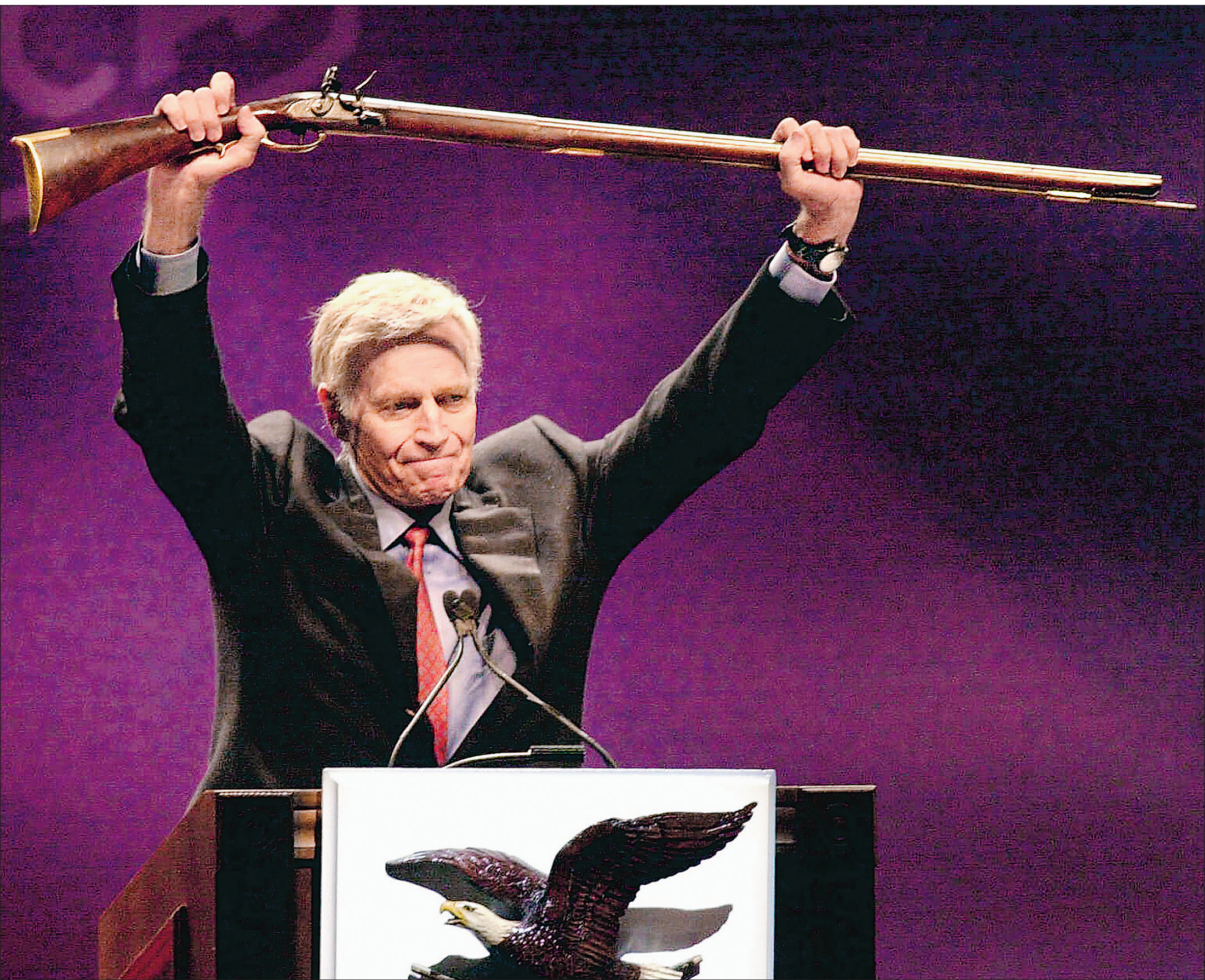
Charlton Heston, brandissant un mousquet au-dessus de sa tête lors de la réunion annuelle de mai 2001 de la National Rifle Association. La NRA avait battu le démocrate Al Gore l'année précédente; elle veut battre John Kerry cette année.