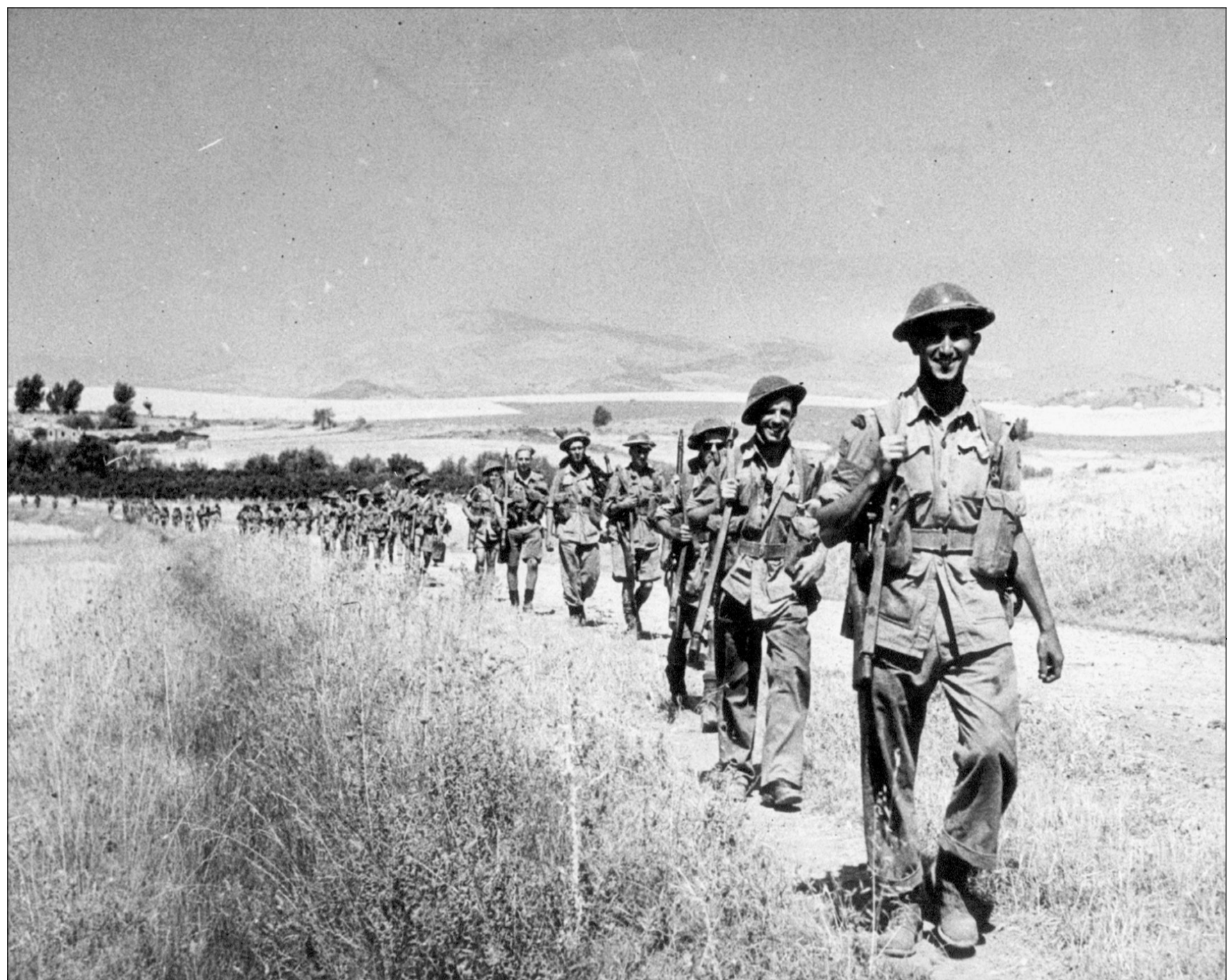
L'été 43, ces soldats du régiment écossais du Canada effectuent une avance de Regalbuto jusqu'à Aderno, en Sicile, île qui fut occupée en 38 jours.

Ces prochains jours, et jusqu'au 4 novembre, des douzaines d'anciens combattants se retrouveront à nouveau en Italie afin de souligner le 60 e anniversaire de leur campagne. Accompagnés par la gouverneure générale du Canada, Adrienne Clarkson, et d'autres dignitaires, ils visiteront d'anciens champs de bataille, des ci-