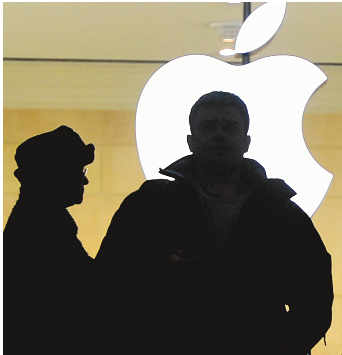
Apple a pris la première place au palmarès des marques les plus puissantes. Mais, l'an prochain, l'entreprise devra surveiller son rival Samsung.