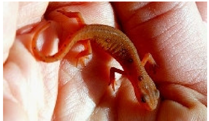
Figure 5 : Triton vert.