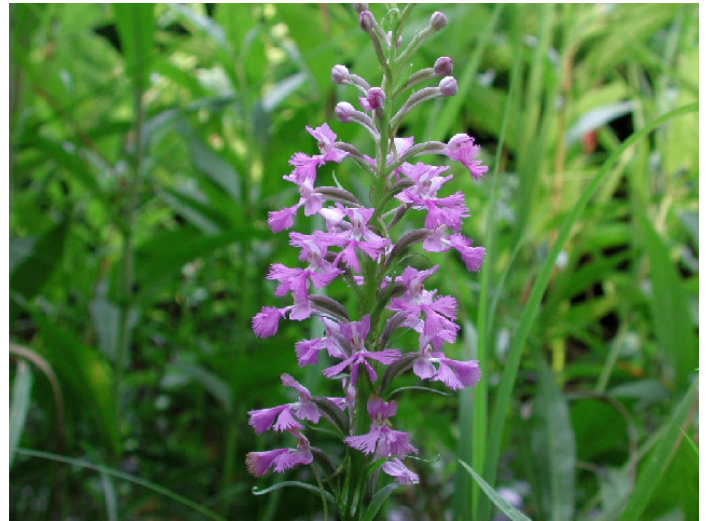
Figure 2 : Platanthera psychodes .

En après-midi, nous avons visité une érablière à érable à sucre et tilleul, sur calcaire; la flore y était évidemment très différente, avec plusieurs cypripèdes soulier, des noyers cendrés, et une plante unique puis-