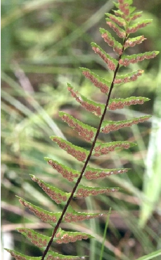
Figure 8: Asplenium platyneuron .

une autre clairière, arbustive celle-là, beaucoup d'aubépines dont deux rares, les Crataegus crus-galli et Crataegus suborbiculata , la première étant limitée à la région de Châteauguay-Léry-Kahnawake (2); puis une petite fougère très rare, la doradille ébène ( Asplenium platyneuron ) (figure 8) fut observée avec seulement deux individus.