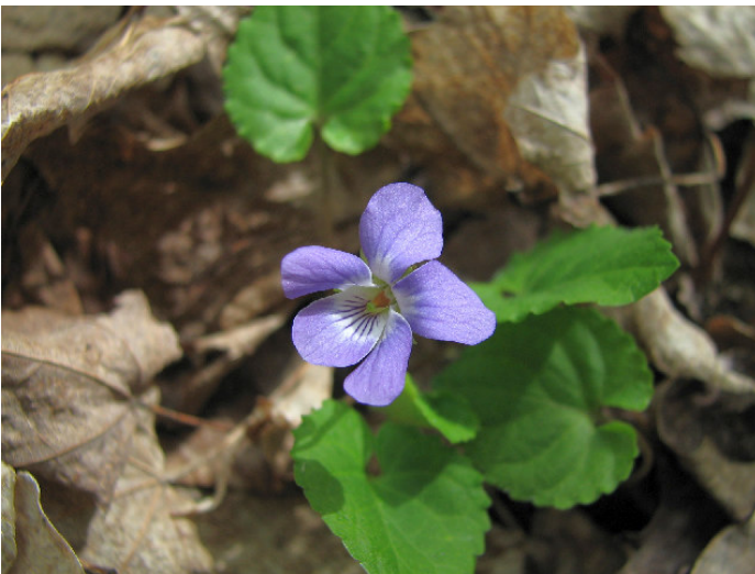
Figure 1 : Viola selkirkii .

Ensuite, dans une frênaie à frêne noir, nous avons découvert la dryoptère de Clinton ( Dryopteris clintoniana ), une fougère rare et susceptible d'être désignée menacée ou vulnérable au Québec (2). Dans une érablière à érable à sucre, tilleul d'Amérique et caryer cordiforme, il y avait du noyer cendré ( Juglans cinerea ), un arbre qui vient d'être ajouté aux espèces susceptibles d'être désignées, et la dryoptère de Clinton (2). Dans cette même catégorie d'espèces rares, nous avons eu la chance de trouver la proserpinie des marais ( Proserpinaca palustris ), qui semble fréquente dans une saulaie inondée par les castors, et près de laquelle se trouve également le bleuet en corymbe ( Vaccinium corymbosum ), un bleuet géant qui peut atteindre cinq mètres de haut; l'arbuste pas le fruit!