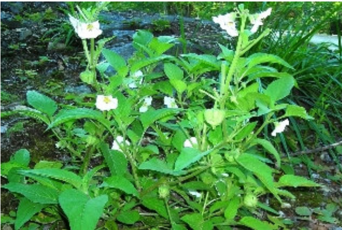
Figure 6 : Leucophysalis grandiflora .

physalis grandiflora (syn. Chamaesaracha grandiflora ), une solanacée (figure 6) annuelle indigène adaptée aux perturbations, puisque ses graines sont probablement entrées en dormance depuis au moins quarante ans, sur ce site puisque la précédente coupe forestière date de 1966. Cependant, peu d'individus apparentent en 2008 et l'espèce semble retrouver sa dormance. Un autre arrêt nous a