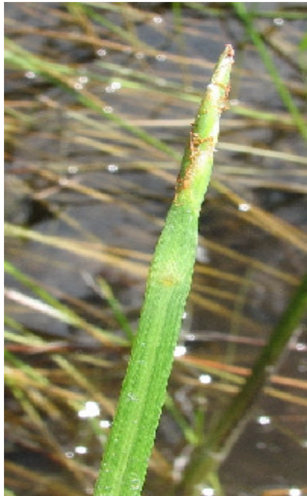
Eleocharis robbinsii