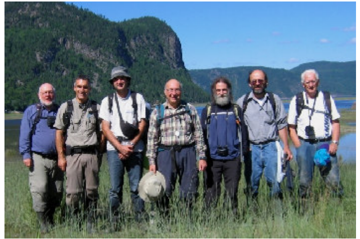
Figure 3 : Le groupe devant la baie Éternité.

On y trouve également une érablière à bouleau jaune mais aussi un marais salé, une prairie riveraine humide et un marécage à frêne noir, peuplier baumier, thuya, sapin et épinette rouge. Dans la prairie, nous avons observé les nouveautés suivantes: Angelica atropurpurea , Cicuta bulbifera , Epilobium leptophyl-