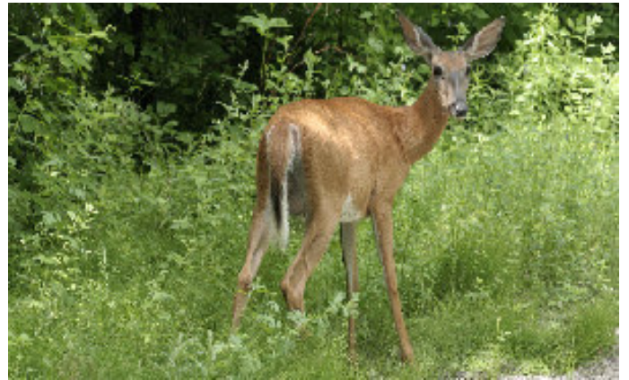
Cerf de Virginie.

À partir de 1947, plusieurs fermes de Longueuil furent cédées au profit de la construction domiciliaire. Ce n'est qu'en 1973 que l'on entreprit les premiers aménagements du secteur où se situe le Parc régional, nommé alors la Base de plein air (1). Dans cet espace vert préservé, une grande diversité de plantes ont pu croître librement de sorte que durant les années 1997 et 1998, le botaniste Jean-Paul Bernard y a inventorié une flore de plus de 600 espèces, incluant celles qui ont été plantées par la Ville (2, 3). On y trouve des dizaines d'arbres et d'arbustes fruitiers (amélanchiers, cerisiers, gadelliers, noisetiers...) et plusieurs centaines de plantes herbacées. Certaines de ces plantes figurent sur la liste des espèces «susceptibles d'être désignées menacées ou vulnérables» du ministère du Développement durable, de l'Environnement et des Parcs comme le carex faux-rubanier, le caryer ovale, le chêne bicolore et la dentaire laciniée. De plus, la Ville y a introduit des espèces rares comme l'aubépine ergot-de-coq, le micocoulier occidental et le noyer cendré. Finalement, il faut mentionner les plantes de sous-bois à croissance lente qui sont vulnérables à la cueillette ou au broutement comme la mat-teuccie fougère-à-l'autruche, la sanguinaire du Canada et le trille blanc.