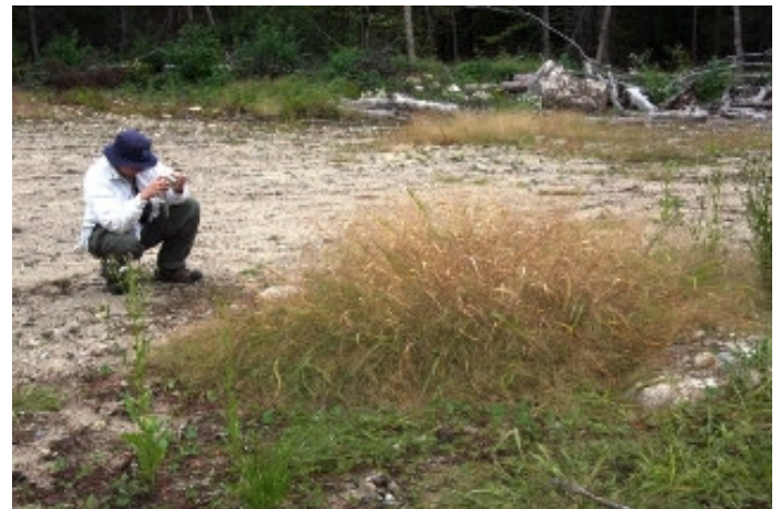
Figure 7: Panicum tuckermanii .

Pour cette dernière sortie de 2008, nous avons été reçus comme des rois au Centre écologique Fer-