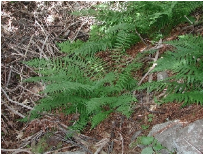
Figure 4 : Dryopteris filix-mas .

la journée, fut celle de la fougère mâle ( Dryopteris filix-mas subsp. brittonii ) (figure 4), par Benoît Larouche qui l'a vue en nombre (plus de 100 couronnes) tout en haut du talus (130-140 m d'altitude); Benoît est retourné sur le site le 10 octobre, pour l'inventorier un peu plus. L'espèce était inconnue du Saguenay et de la rive nord, sauf à Blanc-Sablon (2). Merci à Nathalie Dubé, qui nous a guidé lors de cette journée.