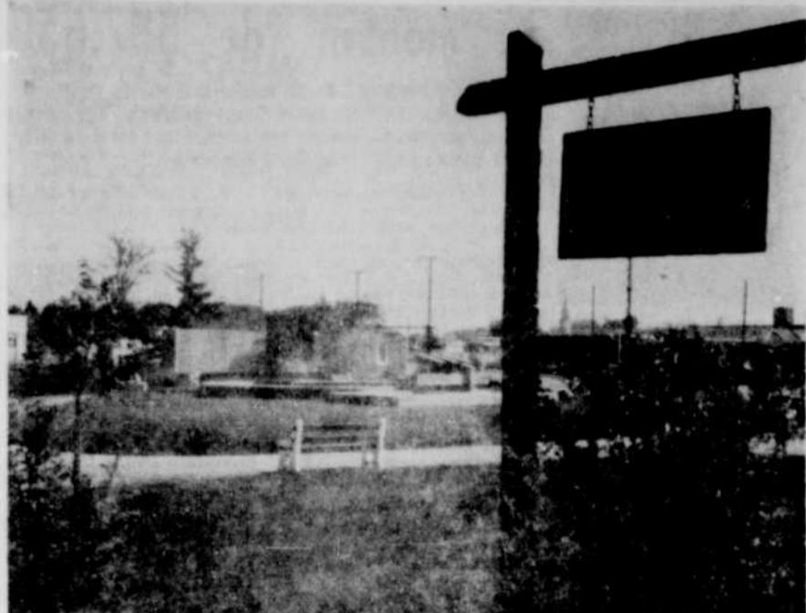
PARC PINARD — Un autre parc, le parc Pinard, sera inauguré lundi prochain, à Drummondville, en présence des autorités. Le monument commémoratif du 150e anniversaire sera aussi dévoilé à cette occasion.