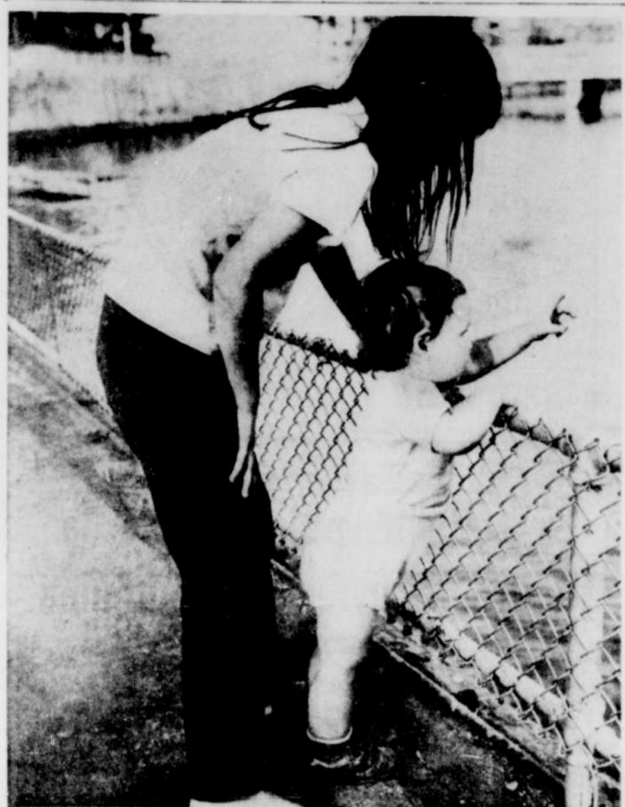
Ce tout jeune enfant semble demander à sa mère: "Maman, les p'tits bateaux qui vont sur l'eau ont-ils des ailes? La photo a été prise au lac Memphrémog, à la pointe Merry, à Magog.