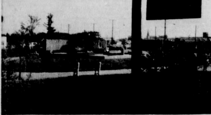
FARC PINARD. — Un autre parc, le parc Pinard, sera inauguré lundi prochain, à Drummondville, en présence des autorités. Le monument commémoratif du 150e anniversaire sera aussi dévoilé à cette occasion.

Projet Par ailleurs, les démarches sont en voie d'être complétées pour l'aménagement d'un complexe de $30,000 sur le terrain industriel de la cité, complexe qui sera réalisé par la firme Québec Propane Gas, avec un bureau, un entrepôt et un réservoir.