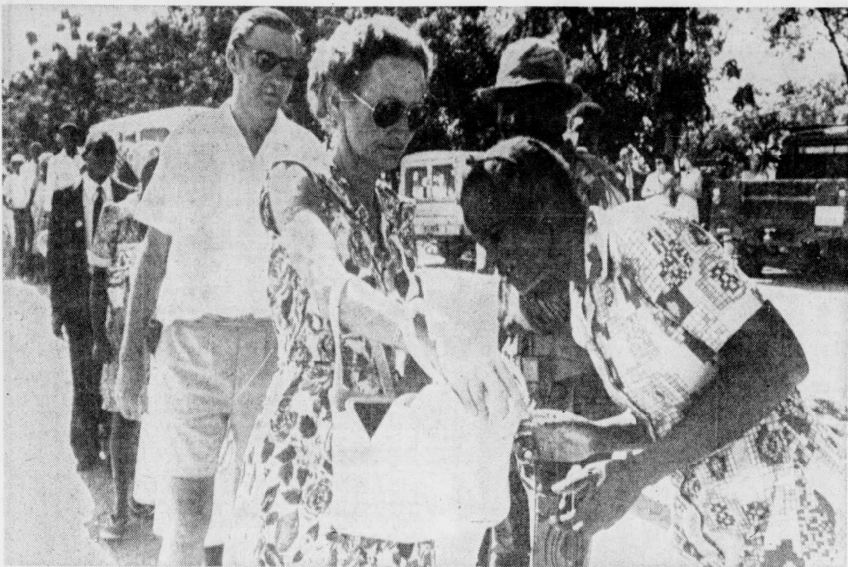
L'épouse d'un fermier blanc doit se soumettre à l'examen de son sac par une préposée noire aux élections, sous l'œil attentif d'un militaire, dans la partie nord de la Rhodésie. Cette région fait face à une forte infiltration de la part des guérilleros.