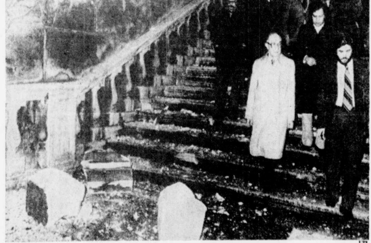
Les dirigeants romains examinent les lieux de l'attentat.

salle même ébranlée par l'explosion de la nuit précédente, une séance extraordinaire du conseil municipal. Le ministre de l'Intérieur, M. Virgilio Rognoni, a réaffirmé à cette occasion la "détermination du gouvernement à intensifier la lutte contre le terrorisme". Détérioré par la déflagration, le salon de Jules-César avait été ouvert exceptionnellement aux conseillers municipaux par les ingénieurs qui ont établi le constat de non-utilisation provisoire. "Amis, voyez en quel état cette salle a été mise", s'est exclamé M. Argan. Les terroristes, a-t-il ajouté, ont porté atteinte "à un endroit sacré. Ce salon de Jules César avait été conçu par Michel-Ange, l'un des plus grands génies de l'humanité. Ce n'est pas Rome seulement qui a été atteinte, mais la civilisation, la culture du monde entier". Le maire a également invité tous les Romains à venir "voir" les effets de l'explosion dans la soirée et manifester ainsi leur solidarité. La fête du 21 avril, date de la fondation de la ville par Romulus, a été maintenue. Rome commémore aujourd'hui son 2,732e anniversaire.