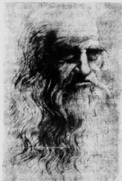
Léonard de VINCI (par lui-même)