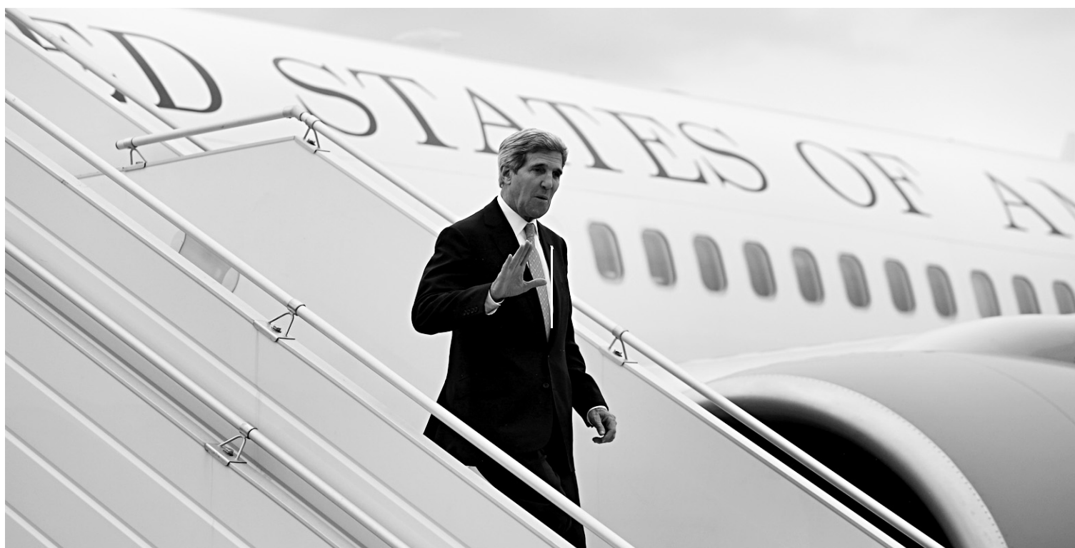
Le secrétaire d'État américain, John Kerry, à son arrivée à Genève vendredi