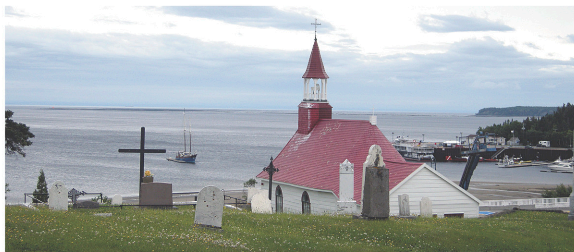
La chapelle des Indiens surplombant le port de Tadoussac et le fleuve Saint-Laurent