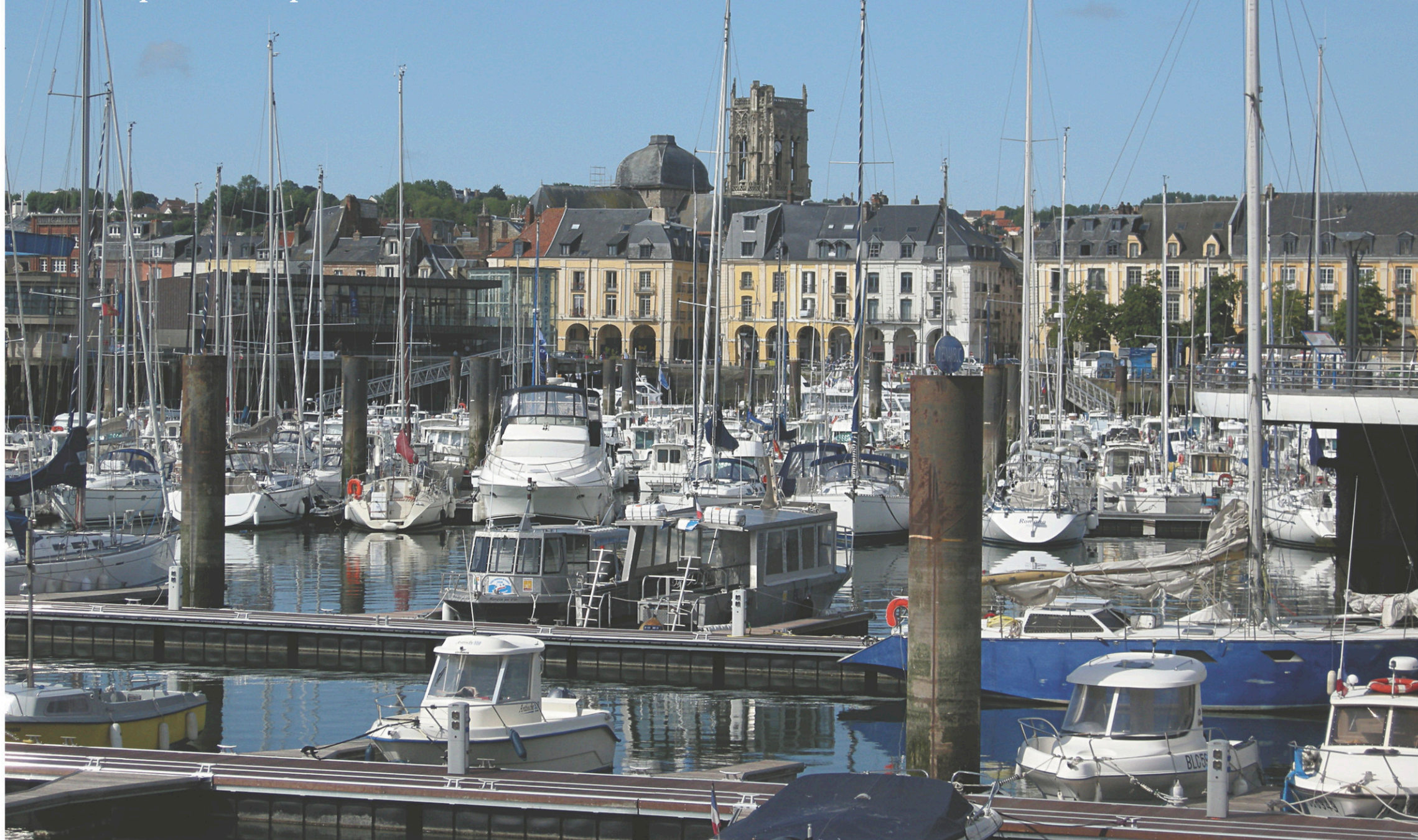
Le port de plaisance Jehan Ango à Dieppe

Ils furent des centaines à y mettre les voiles vers la Nouvelle-France pendant la première moitié du XVII e siècle