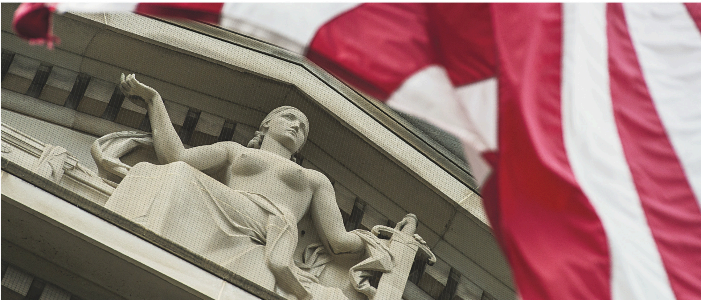
Une statue trône au ministère américain de la Justice à Washington. Le président Donald Trump contredit ses services secrets à propos de l'ingérence russe et veut renvoyer le ministre de la Justice qu'il a lui-même choisi, Jeff Sessions.

CAHIER B > LE DEVOIR, LES SAMEDI 29 ET DIMANCHE 30 JUILLET 2017